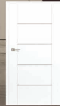
Drzwi Asteria z ościeżnicą i montażem – 999 zł*

Oferta ważna do 18.04.2025. Ceny oznaczone * obowiązują przy zakupie minimum 2 sztuk. Podane ceny okna oraz rolety zewnętrznej są przykładowymi kalkulacjami rozmiaru 140 x 140 cm. Więcej na www.pendragon.pl