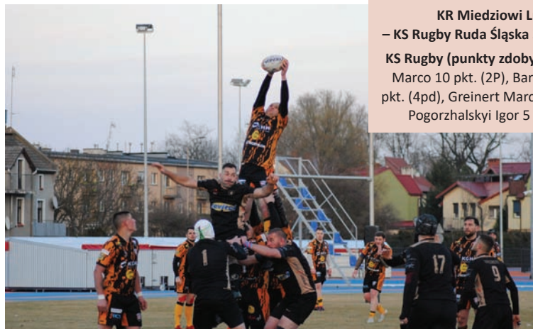
Gryfy mogły zdobyć punkty, jednak zwycięstwo wymknęło się w końcówce.

W sobotnie popołudnie 15.03. br. rudzkie Gryfy rozpoczęły wiosenną rundę II ligi od wyjazdowego spotkania z Miedziami Lubin. Spotkanie lepiej rozpoczęli goście, zdobywając szybko dwa przyłożenia, głównie wykorzystując przewagę w formacji młyna. Na szczęście rudzianie szybko się otrząsnęli i ruszyli odrabiać straty. Kilukrotnie byli blisko przedarcia się na pole punktowe gospodarzy, jednak za każdym razem zawodziło „ostatnie