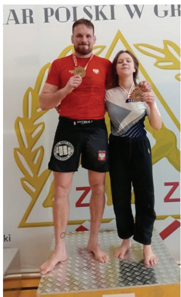
Puchar Polski to kolejny świetny występ w tym roku dla Nelson Club.