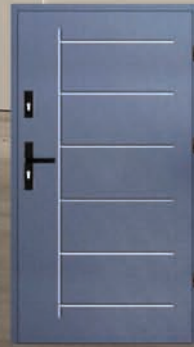
Drzwi wejściowe do domu lub mieszkania z wymianą – 2539 zł