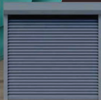
Roleta zewnętrzna z montażem – 729 zł*