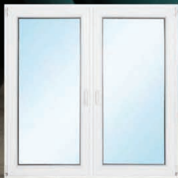
Okno z 3 szybami i wymianą – 1499 zł*