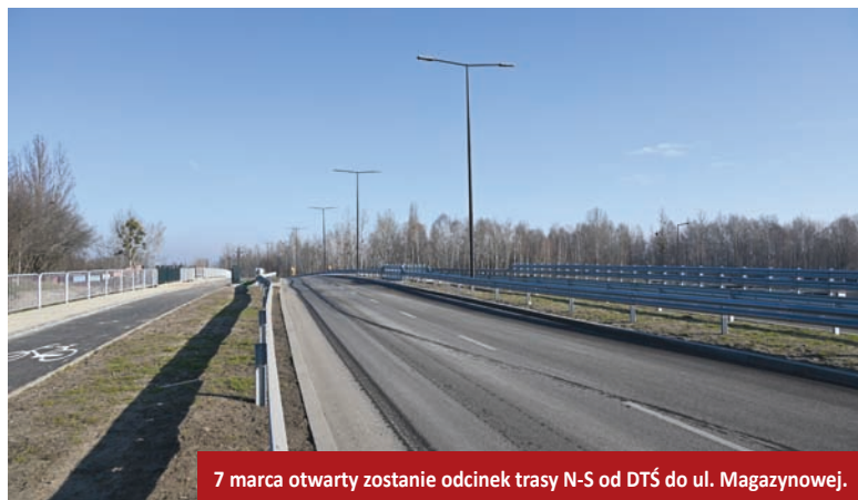
7 marca otwarty zostanie odcinek trasy N-S od DTŚ do ul. Magazynowej.

Obecnie trwa przetarg na budowę odcinka trasy N-S od ul. Bielszowickiej do węzła autostradowego. Przy tej okazji przebudowany zostanie też fragment ul. 1 Maja. Na inwestycję władze Rudy Śląskiej pozyskały ponad 200 mln zł unijnego dofinansowania. Dzięki budowie tego odcinka w całości domknięte zostanie połączenie pomiędzy Drogową Trasą Średnicową a autostradą A4. Planowane jest dalsze przedłużenie trasy N-S na południe, do granicy z Mikołowem, co stworzy obwodnicę Halemby.