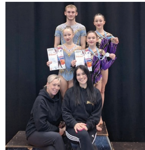
Występ w Riesa to obiecujący początek sezonu dla zawodniczek KPKS Halemba.