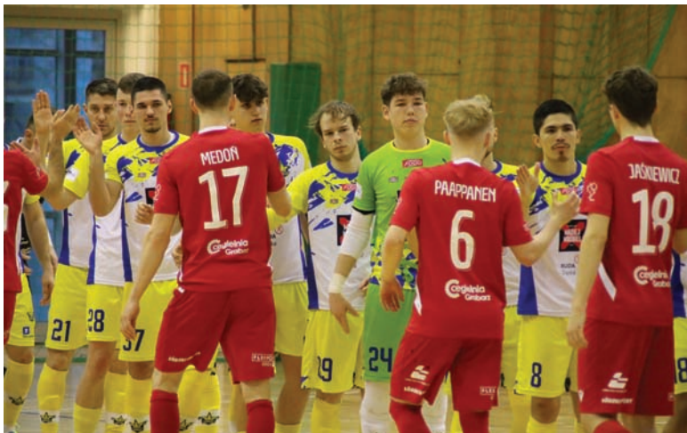
Kolejny mecz Gwiazda rozegra 15 marca z BSF ABJ Bochnia na wyjeździe w ramach 25. kolejki FOGO Futsal Ekstraklasy.

Gwiazda Ruda Śląska – Widzew Łódź 5:7(0:3)