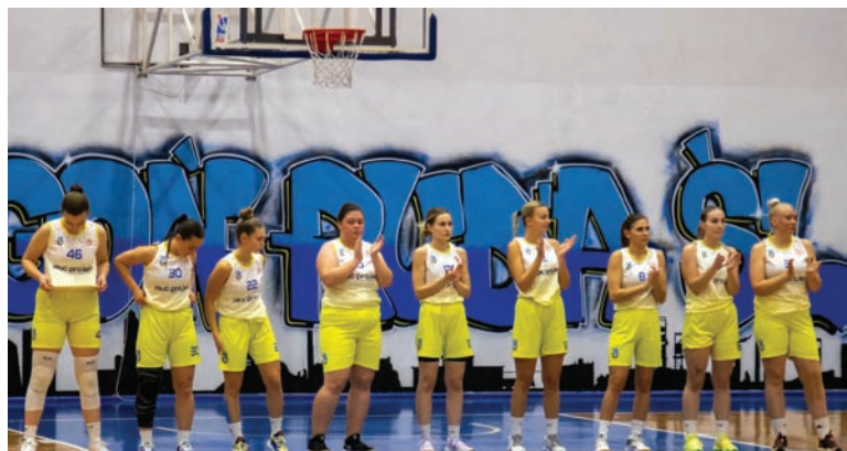
Po udanym sezonie nadszedł czas na odpoczynek i potem ruszy praca przed kolejnym.

Pogoń Ruda Śląska – RKK AZS Racibórz 80:53 (24:17, 17:14, 17:7, 25:15)