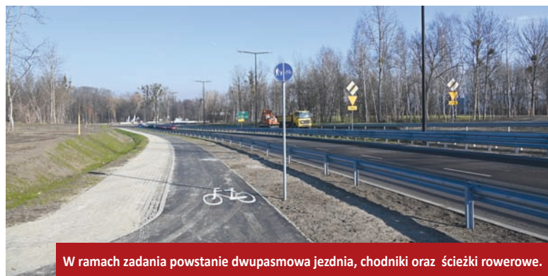
W ramach zadania powstanie dwupasmowa jeźdnia, chodniki oraz ścieżki rowerowe.

W ramach inwestycji powstaną trzy zbiorniki retencyjne. Powstanie pod-