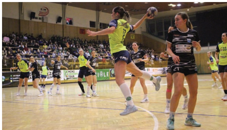
W Derbach Rudy Śląskiej lepsze okazały się zawodniczki Grunwaldu.

W sobotę, 18 stycznia hala MOSiR przy ul. Kłodnickiej 95 stała się areną pasjonujących sportowych emocji. Derby Rudy Śląskiej w I lidze kobiet grupy B przyciągnęły zarówno fanów SPR Grunwald Ruda Śląska, jak i KS Zgoda Ruda Śląska. To starcie lokalnych rywali, pełne zwrotów akcji i determinacji, zakończyło się zwycięstwem Grunwaldu 38:23. Spotkanie zapowiadało się niezwykle emocjonująco, bo obie drużyny zajmują wysokie miejsca w tabeli. KS Zgoda przystępowała do meczu z 18 punktami na koncie, zajmując 3. miejsce, podczas gdy Grunwald, z dwoma zaległymi spotkaniami, plasował się tuż za nimi, na 4. pozycji z 12 punktami.