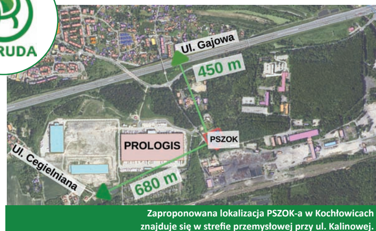
Zaproponowana lokalizacja PSZOK-a w Kochłowicach znajduje się w strefie przemysłowej przy ul. Kalinowej.