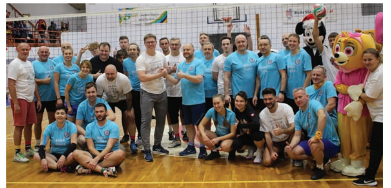
Wspólne zdjęcie drużyn po zakończonym meczu.

Pierwszy set był niezwykle wyrównany – oba zespoły grały jak równy z równym, ale końcówka należała do drużyny gospodarzy, która wywalczyła kluczowe punkty, zwyciężając 25:22. Drugi set również obfitował w wyrównaną walkę, choć z nieco większą przewagą Rudy Śląskiej. Trzeci set był prawdziwym sportowym rollercoasterem. Po zaciętym początku drużyna Świętochłowic wyszła na znaczące, niemal dziesięciopunktowe prowadzenie. Jednak rudzianie, z niesamowitą determinacją,