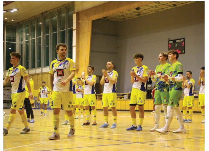
Po osiemnastej kolejce Gwiazda zajmuje 13 pozycję w tabeli FOGO Ekstraklasy.

Po zmianie stron gospodarze rzucili się do odrabiania strat, jednak świetne interwencje bramkarzy obu drużyn nie pozwa-