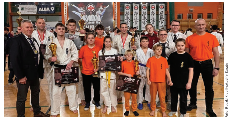
Rudzianie zajęli czwarte miejsce w klasyfikacji drużynowej.