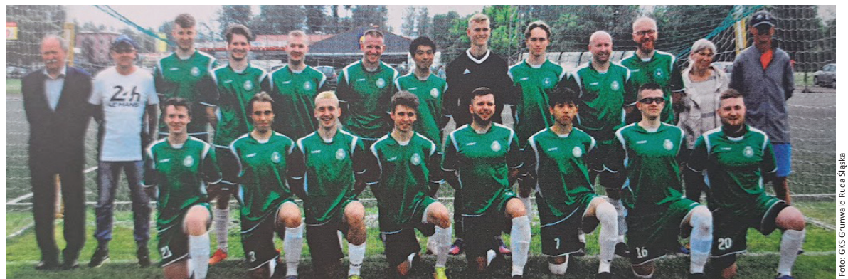
Zespół GKS Grunwald Ruda Śląska na zakończenie sezonu 2022/2023.

Najbliższy mecz GKS Grunwald Ruda Śląska rozegra 29 marca 2025 roku. Będzie to domowe spotkanie z GKS Górnik 09 Mysłowice, które odbędzie się przy ul. Kłodnickiej 54 w Rudzie Śląskiej. MP