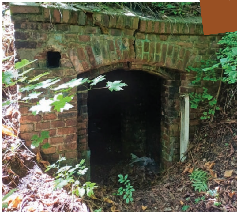
Budynek dawnej prochni to pozostałość po kopalni Brandenburg w Rudzie.

ności lokalne, które zbudowały swoje tradycje wokół przemysłu, wokół górnictwa, cały czas dzięki tym wartościom, dzięki silnej tożsamości, dobrze zorganizowanej sieci różnego rodzaju organizacji społecznych, przeróżnych community centers w małych społecznościach oraz wymianie międzypokoleniowej, cały czas są nośnikami właśnie tej tożsamości wyrosłej z przemysłu. Oczywiście tutaj będzie też kolejny problem, polegający na tym, jak włączyć w ten nasz system wartości i w naszą tożsamość ludzi, którzy w pewnym momencie się pojawią jako ludność napływowa. To w pewnym sensie dzieje się już od wielu lat, ale będzie niepostrzeżenie przez kolejne dekady się rozwijało. Musimy być przygotowani na to, jak tę naszą tożsamość, jej sposób komunikowania i manifestowania promować w sposób na tyle otwarty i atrakcyjny równocześnie, żeby ci nowi mieszkańcy, nowi rudzianie,