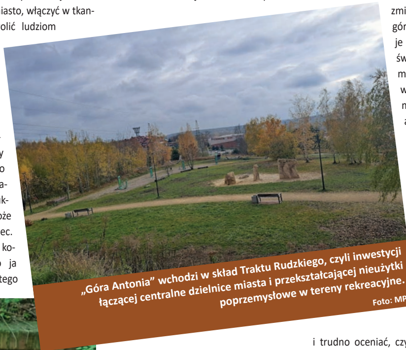
„Góra Antonia” wchodzi w skład Traktu Rudzkiego, czyli inwestycji łączącej centralne dzielnice miasta i przekształcającej nieużytki poprzemysłowe w tereny rekreacyjne.

ności lokalne, które zbudowały swoje tradycje wokół przemysłu, wokół górnictwa, cały czas dzięki tym wartościom, dzięki silnej tożsamości, dobrze zorganizowanej sieci różnego rodzaju organizacji społecznych, przeróżnych community centers w małych społecznościach oraz wymianie międzypokoleniowej, cały czas są nośnikami właśnie tej tożsamości wyrosłej z przemysłu. Oczywiście tutaj będzie też kolejny problem, polegający na tym, jak włączyć w ten nasz system wartości i w naszą tożsamość ludzi, którzy w pewnym momencie się pojawią jako ludność napływowa. To w pewnym sensie dzieje się już od wielu lat, ale będzie niepostrzeżenie przez kolejne dekady się rozwijało. Musimy być przygotowani na to, jak tę naszą tożsamość, jej sposób komunikowania i manifestowania promować w sposób na tyle otwarty i atrakcyjny równocześnie, żeby ci nowi mieszkańcy, nowi rudzianie,