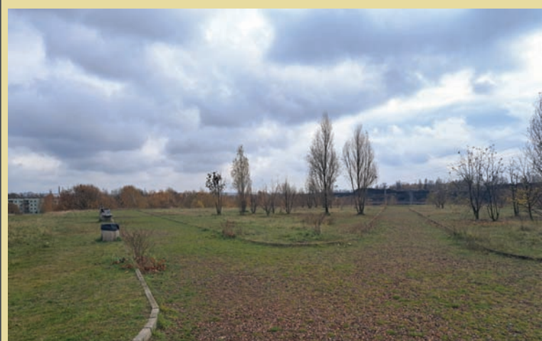
Zrewitalizowana hałda pocynkowa w rejonie ulic Niedurnego i Furgoła jest jedną z czterech lokalizacji w naszym województwie, które objęte zostaną demonstracyjnym wdrożeniem w ramach projektu zintegrowanego LIFE „Śląskie. Przywracamy błękit”.

Czwarta przyroda budzi coraz większe zainteresowanie ekologów i urbanistów, ponieważ takie tereny, mimo że często postrzegane jako „nieużytki”, pełnią istotne funkcje ekologiczne: wspierają bioróżnorodność, stanowią siedliska dla rzadkich gatunków roślin i zwierząt, a także pomagają w ograniczeniu miejskiego efektu wyspy ciepła.