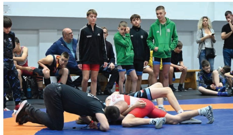
Kilkudziesięciu zawodników walczowało w m.in. w kategoriach dzieci oraz młodzików.

śniczy, a w przeszłości zawodnik. W niedzielę uhonorowano jego 40-lecie pracy właśnie jako sędziego.