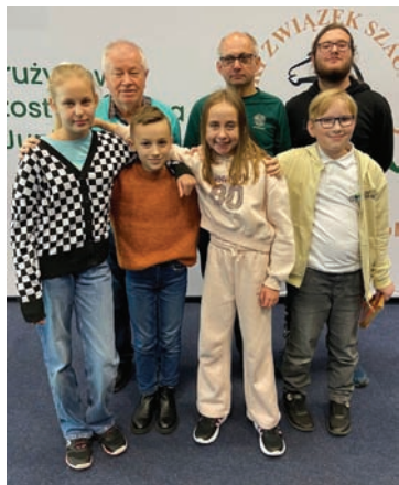
W Chorzowie RKS ostatecznie zajął 12. miejsce.

W kolejny weekend RKS utrzymał swoją 12. pozycję. Złożyły się na to zwycięstwa 4,0-2,0 z UKS-em Ognisko Ciepłownia Rydułtowy III i 5,0-1,0 z MKSz Diagonalia Imielin II oraz porażki 1,0-5,0 z UKS-em 21