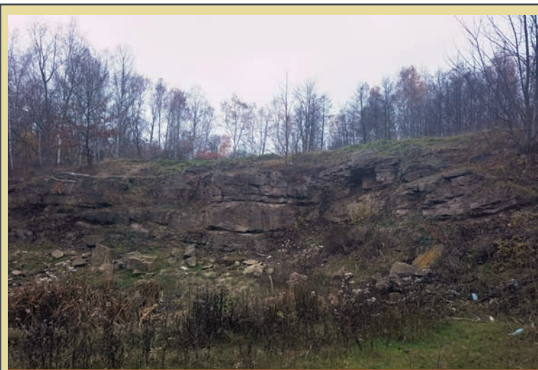
Steinbruch – teren dawnego kamieniołomu w Rudzie. Miejsce to jest przykładem tzw. czwartej przyrody.