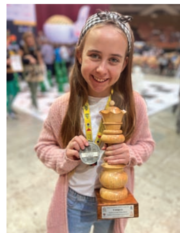
Utalentowana rudzianka poniosła tylko jedną porażkę w ośmiu grach.

Ponadto w Katowicach wystąpił inny zawodnik RKS-u – Leon Lewiński (SP nr 24 w Rudzie Śląskiej), który w rywalizacji chłopców z klas czwartych zdobył 6/8 pkt.