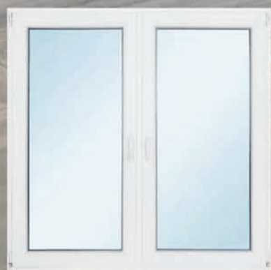
Energooszczędne okno z 3 szybami z wymianą – 1479 zł* Wycena dla rozmiaru 140x140 cm