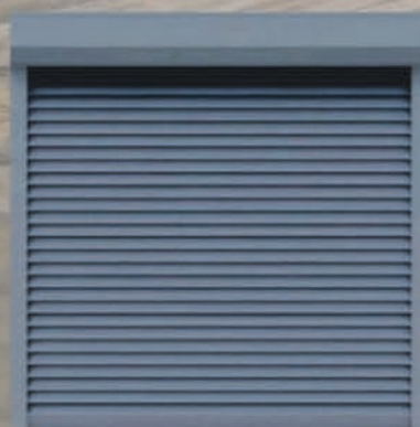
Roleta zewnętrzna z montażem – 699 zł* Wycena dla rozmiaru 140x140 cm