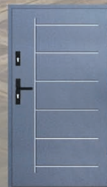
Drzwi wejściowe z wymianą – 2549 zł Wycena dla rozmiaru 80 lub 90

Oferta ważna do 31.10.2024. Ceny oznaczone * obowiązują przy zakupie minimum 2 sztuk. Więcej na www.pendragon.pl