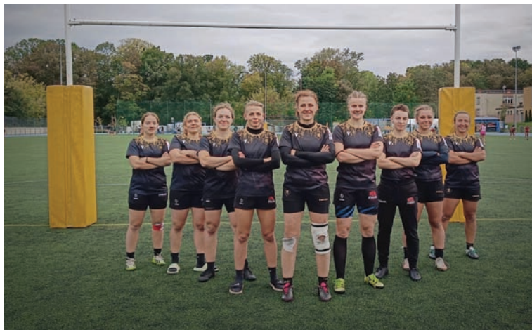
Pięte miejsce w Mińsku Mazowieckim pozwoliło Diablicom zachować miejsce w Ekstralidze.

28 września w Mińsku Mazowieckim rozegrano pierwszy turniej z cyklu Mistrzostw Polski Kobiet w Rugby 7. Rudzkie Diablice zajęły w nim piąte miejsce.