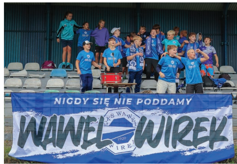
Doping grupy młodych kibiców z Wirku poniósł gospodarzy do zwycięstwa.