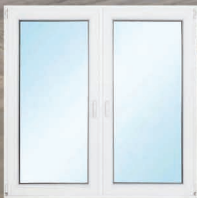
Energooszczędne okno z 3 szymbami z wymianą – 1479 zł* Wycena dla rozmiaru 140x140 cm