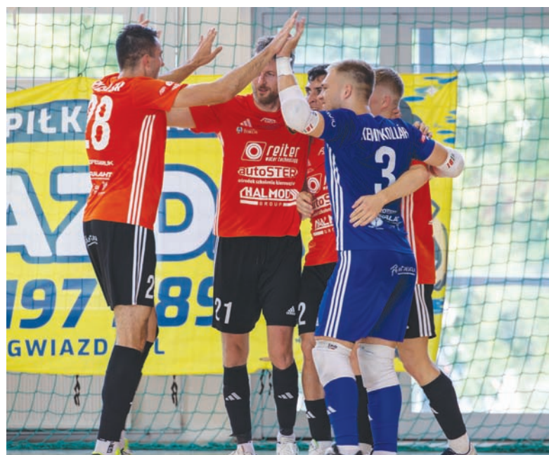
Trzy gole w pierwszej połowie dla FC Toruń ustawiły przebieg spotkania.