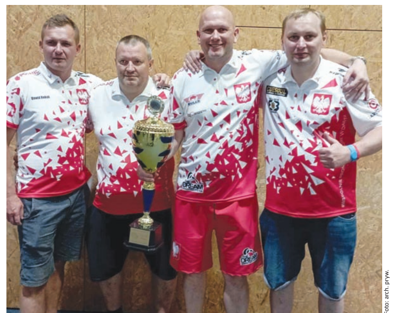
Polska drużyna nie miała sobie równych i pewnie sięgnęła po tytuł mistrzowski.