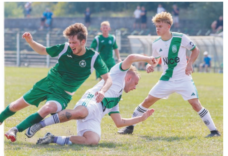
Po dobrej pierwszej połowie Grunwald zagrał bardzo słabe drugie 45 minut i zasłużenie przegrał.