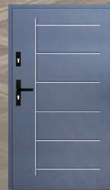
Drzwi wejściowe z wymianą – 2549 zł Wycena dla rozmiaru 80 lub 90

Oferta ważna do 30.9.2024. Ceny oznaczone * obowiązują przy zakupie minimum 2 sztuk. Więcej na www.pendragon.pl