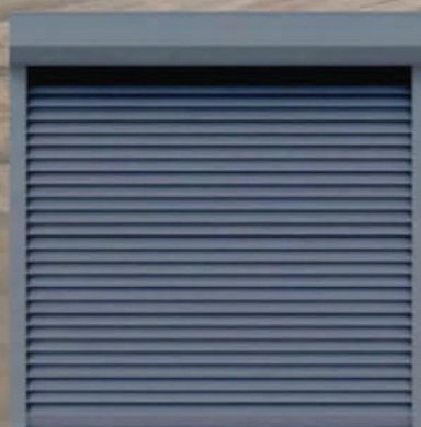
Roleta zewnętrzna z montażem – 699 zł* Wycena dla rozmiaru 140x140 cm