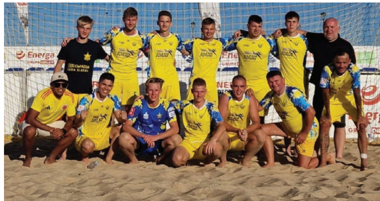
Mimo dwóch porażek w dwóch pierwszych meczach Gwiazda zdołała wyjść z grupy i wywalczyć awans do Ekstraklasy beach soccera.

Dla Gwiazdy jednak najwyraźniej im trudniej, tym lepiej, gdyż pokonali faworyta 6:3 i zameldowali się w ćwierćfinale rozgrywek. Tu czekała drużyna Poker Team Lublin, z którą rudzianie wygrali 6:2.