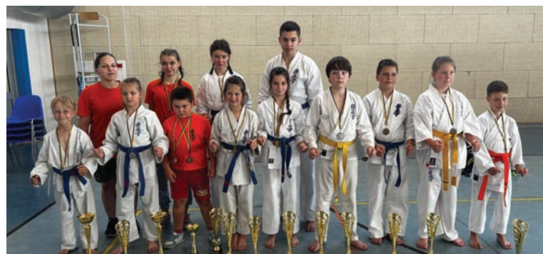
Rudzianie stawali na podium w Katowicach szesnastokrotnie.

Przedstawiciele Rudzkiego Klubu Kyokushin Karate wzięli udział w III Ogólnopolskim Turnieju Karate Kyokushin IKO Czarni Cup. Zawody te odbyły się 15 czerwca w Katowicach.