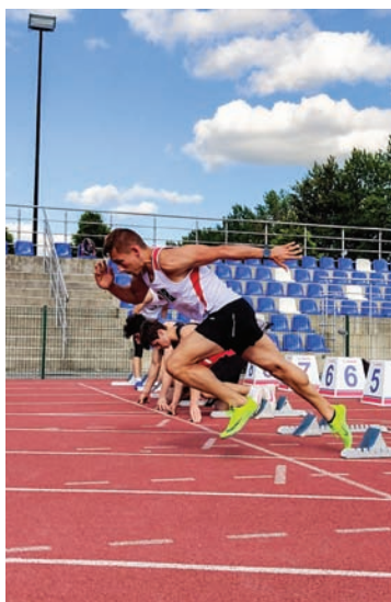
Tradycyjny mityng TL Pogoni przyciągnął dziesiątki uczestników – sprinterów, miotaczy i skoczków.