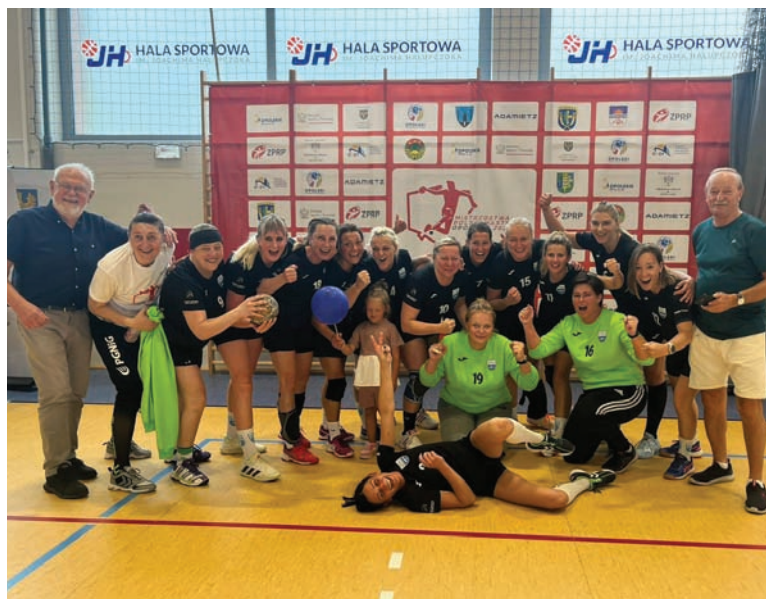
Rudzka drużyna wygrała w Turawie cztery spotkania, w tym decydujące o tytule mistrzowskim.

W dniach 8-9 czerwca w Turawie odbyły się Mistrzostwa Polski Masters, w których wzięła udział drużyna Zgody Ruda Śląska. Z województwa opolskiego nasza drużyna przywiozła złoto!