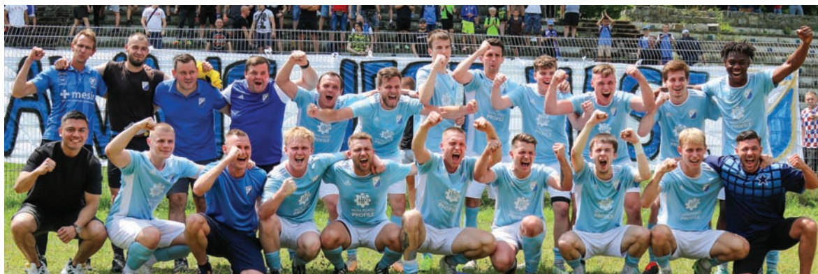
Po roku przerwy „Slavioki” wracają do klasy okręgowej.