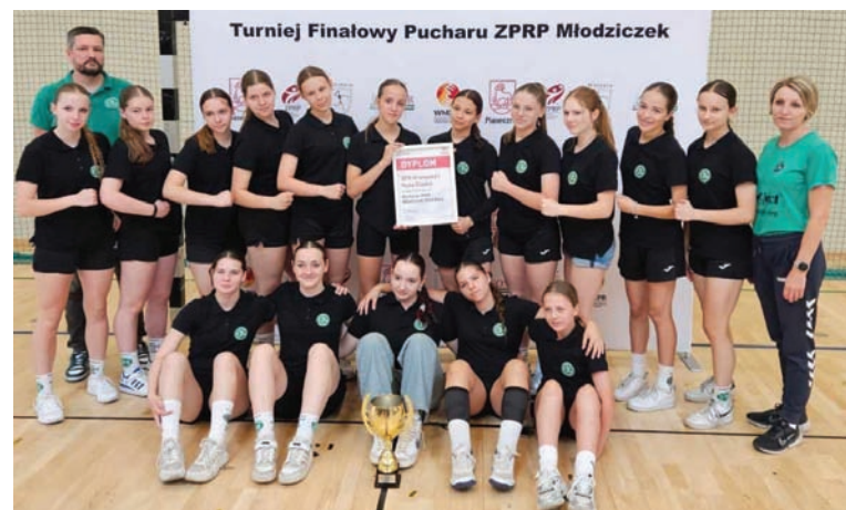
Mimo porażki w meczu o brązowy medal szczypiornistki SPR-u mogą być dumne ze swojego osiągnięcia.

Oznaczało to, iż w półfinale turnieju zmierzą się z UKS-em Banino, który w swojej grupie zajął drugie miejsce. Niestety, mimo zaciętej rywalizacji i prowadzenia do przerwy 13:12 „Zielone” zeszły z parkietu pokonane w stosunku 26:29. SPR-owi pozostał do rozegrania mecz o trzecie miejsce – tu rywalkami ponownie były szczypiornistki z Lubina.