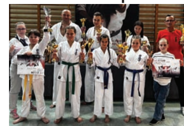
32 punkty zdobyte przez rudzian pozwoliły na zajęcie 3. miejsca w rankingu drużyn.