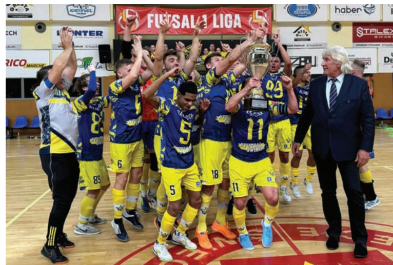
Niezwykle emocjonujący mecz rewanżowy zakończył się po myśli rudzian.