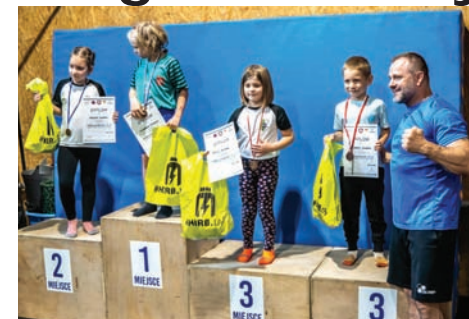
Jednym z punktów programu obchodów był turniej zapaśniczy dla najmłodszych adeptów tego sportu.