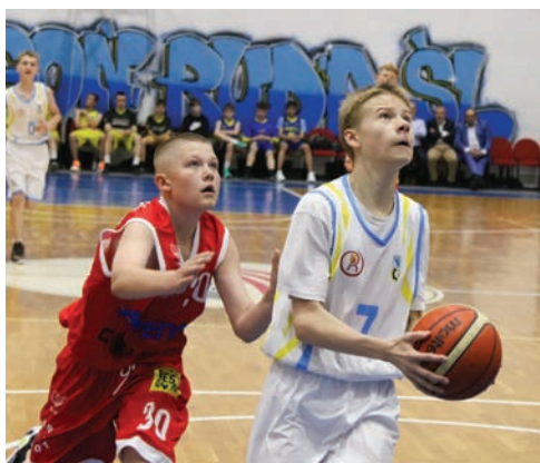
W zeszłorocznej edycji pucharu wzięły udział cztery drużyny.