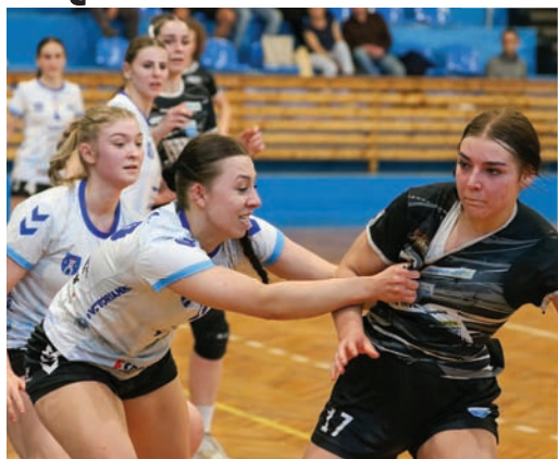
Dla Zgody była to siódma porażka w sezonie.

Choć sport niejednokrotnie pokazuje, jak bardzo jest przewrotny, to trudno wytłumaczyć czwartkową (9.05)