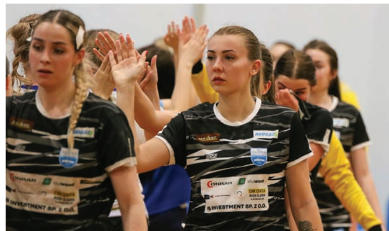
Kiepska postawa w drugiej połowie sprawiła, że rudzianki musiały przelknąć gorzkie porażki.