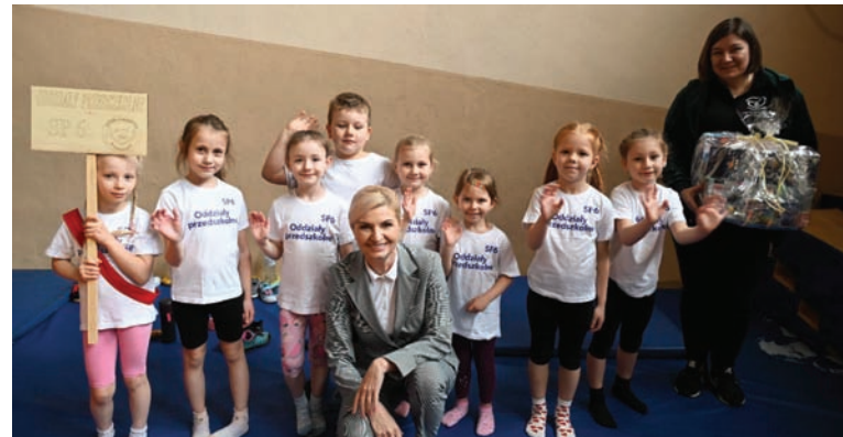
Podczas zawodów nie zabrakło uśmiechów. Na zdjęciu wiceprezydent Anna Krzyszczo z dziećmi z SP nr 6. DK

W hali sportowej przy ulicy Bytomskiej (Orzegów) odbyła się Olimpiada Sportowa, w której wzięły udział dzieci z pięciu placówek oświatowych: miejskich przedszkoli nr 9, 12 oraz 44, a także z oddziałów przedszkolnych przy szkołach podstawowych nr 6 i 36. Zawody były okazją nie tylko do sportowej rywalizacji najmłodszych, ale także do kultywowania aktywności fizycznej. Pierwsze miejsce w zmaganiach zdobyły dzieci z MP nr 44 przed SP nr 36 i MP nr 9. DK