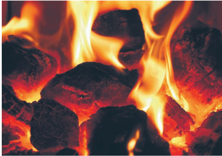
Dodatek węglowy będzie wynosił 3 tys. zł.

Wniosek można również umieścić w skrzynce podawczej MOPS. W przypadku skorzystania z takiej formy złożenia wniosku wskazane jest dołączenie do wniosku numeru telefonu kontaktowego wnioskodawcy, aby ułatwić