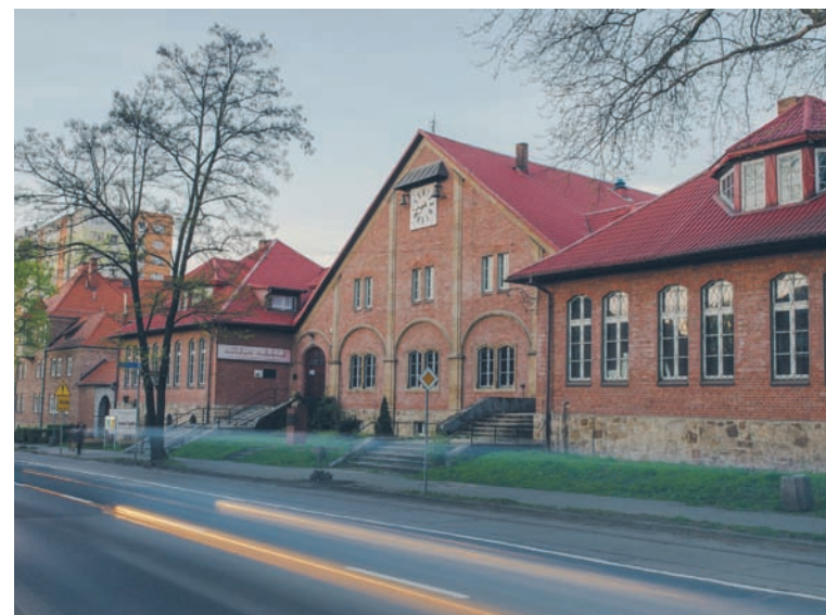
Wystawa w rudzkim Muzeum Miejskim ma szansę na uzyskanie prestiżowej nagrody.

niejszego przemysłu na terenie dzisiejszej Rudy Śląskiej, przede wszystkim kuźnice, w których wykorzystywano złoża metali, w jakie były bogate te ziemie. Kolejne sale pokazują, jak zmienił się Górny Śląsk pod wpływem odkrycia węgla kamiennego, aż do rewolucji przemysłowej. Przed przejściem do współczesności zwiedzający poznają jeszcze Polską Rzeczpospolitą Ludową. Dla zrozumienia wszystkich czynników kształtujących gospodarkę ukazano również konflikty zbrojne na terenie Górnego Śląska. Ponadto w ramach wystawy wydzielono strefę prezentującą życie rodzinne, aktywność społeczną i polityczną oraz rolę religii w życiu mieszkańców Rudy przełomu XIX i XX w.