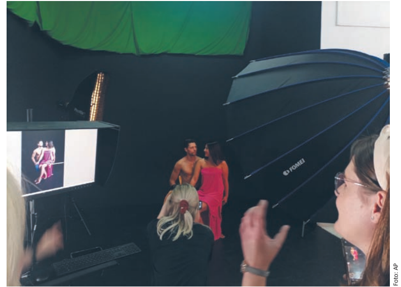
Kalendarz na 2023 rok będzie promować profilaktykę chorób kardiologicznych.