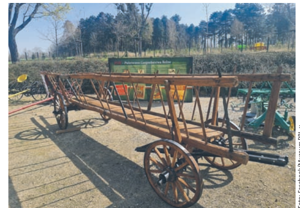
Nową atrakcją będzie wóz drabiniasty, na którym umieszczone zostaną snopki.