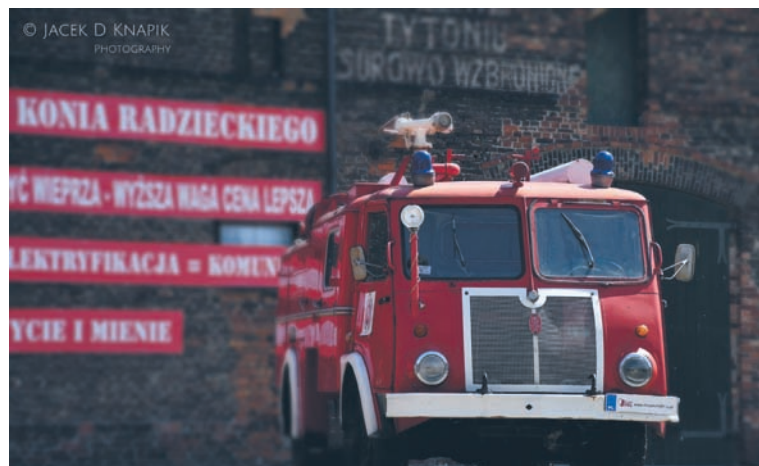
Dużym zainteresowaniem gości cieszy się wystawa pojazdów z czasów PRL-u.