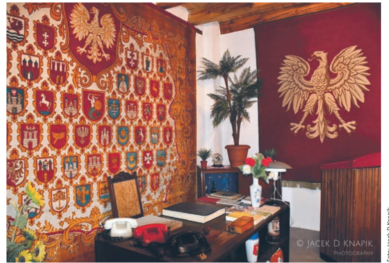
Jedną ze stałych ekspozycji w Muzeum PRL-u jest gabinet pierwszego sekretarza.

Dodajmy, że bielszowickie Muzeum PRL-u działa od czerwca 2010 roku. Z tej okazji w 2020 roku miała zostać zorganizowana impreza urodzinowa.