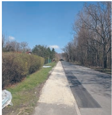
Wymiana chodnika przy ul. Partyzantów trwała miesiąc.

Remont chodnika zakończył się 4 kwietnia, a koszt jego naprawy wyniósł 70 tys. zł. Zadanie zostało zrealizowane z remontów bieżących. – Dziękujemy za to wszystkim zaangażowa-