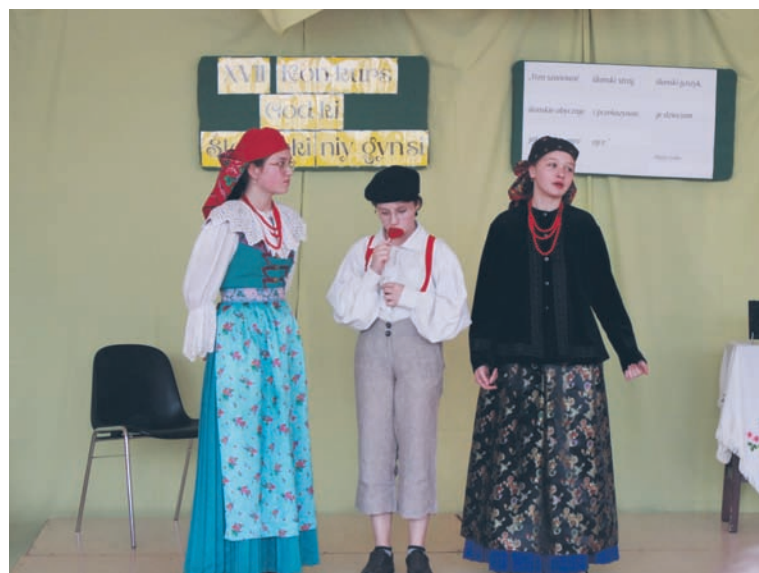
Na scenie zaprezentowało się ponad 20 uczniów z rudzkich szkół.

W Szkole Podstawowej nr 22 w Nowym Bytomiu odbyła się XVII edycja Międzyszkolnego Konkursu Godki „Ślonzoki niy gynsi”. W tym roku do rywalizacji stanęli uczniowie szkół podstawowych oraz ponadpodstawowych, którzy zaprezentowali teksty śląskich twórców lub własne kompozycje w gwarze śląskiej.