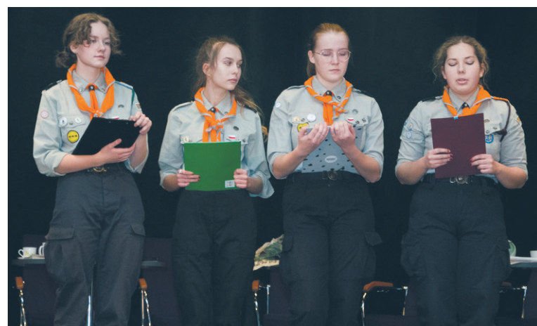
Podczas gali przypomniano historię powstania drużyny.