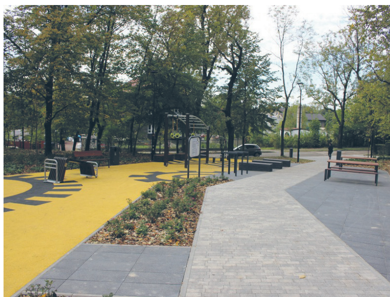
Na odcinku Tuwima/Katowicka utworzono m.in. siłownię na powietrzu, stoły piknikowe oraz trampolinę i tyrolkę.