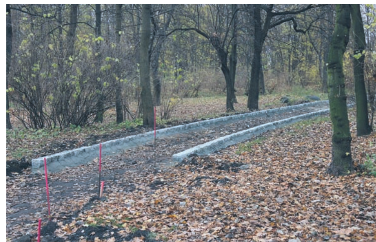
W Parku Dworskim wytyczane są już pierwsze alejki spacerowe.