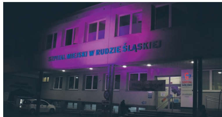
Symbolem Światowego Dnia Wcześnieńki jest kolor fioletowy. Właśnie takim światłem 17 listopada w godzinach popołudniowych został oświetlony budynek Szpitala Miejskiego.