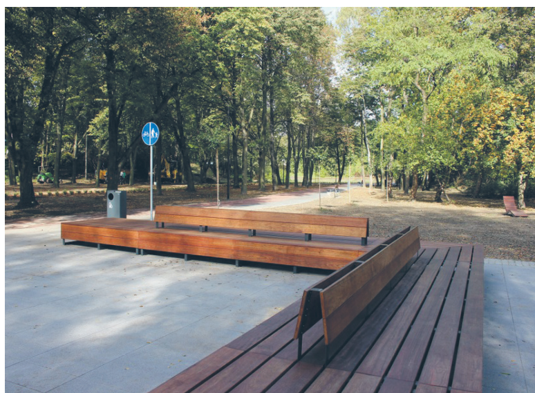
Na zrewitalizowanych terenach nie brakuje miejsc do wypoczynku – tu skwer na tzw. trasie św. Wawrzyńca.

nych ok. 130 nowych sadzonek, a do tego liczne krzewy i rośliny cebulowe. Ponadto powstaną nowe ławki, kosze na śmieci, a oświetlenie wymienione zostanie na energooszczędne. Oprócz uporządkowania zieleni i elementów małej architektury, powstanie rozarium, czyli kolekcja róż, która zostanie umieszczona w tylnej części parku. Czas na realizację zadania to 180 dni od momentu oddania terenu wykonawcy. Jeżeli więc pozwolą na to warunki atmosferyczne, zrewitalizowanym miejscem będziemy mogli cieszyć się już wiosną przyszłego roku.