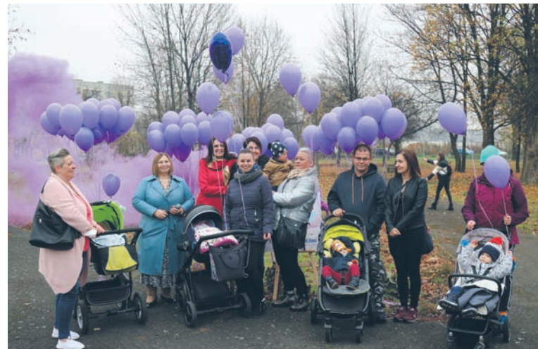
W tym roku Światowy Dzień Wcześnieńki z powodu pandemii zorganizowano w wąskim gronie w plenerze.