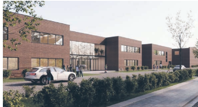
Tak w przyszłości ma wyglądać budynek SP nr 17 w Bielszowicach.

Ogółem w części przedszkolnej utworzone zostaną cztery sale dla przedszkolaków, natomiast w części szkolnej 20 sal lekcyjnych dla uczniów klas 1-8. Każda klasa będzie miała swój indywidualny dziedziniec. Zastosowanie takiego rozwiązania pozwoli również na zrównoważone oświetlenie sal lekcyjnych naturalnym światłem przez cały dzień. Umożliwi to także na prowadzenie części zajęć