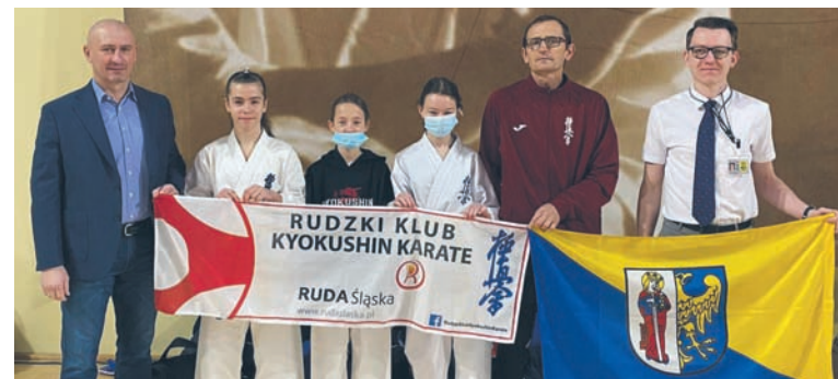
Młodzi karatecy reprezentowali swój klub oraz Rudę Śląską.