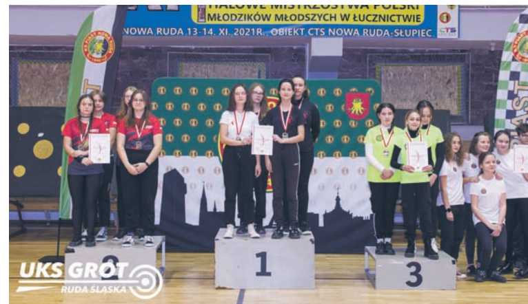
Drużyna dziewcząt UKS Grot Ruda Śląska wywalczyła wicemistrzostwo.