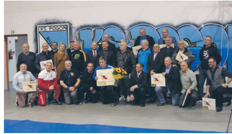
Podczas zawodów nie zabrakło wielu gości oraz słynnych zapaśników.