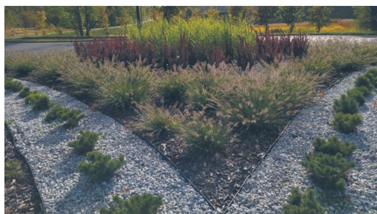
Pracownicy MPGM TBS na nowo zagospodarowali rondo przy ul. Zabrzeńskiej. Tak wyglądają efekty prac.

Dodatkowo w pobliskich donicach kwiaty sezonowe zamieniono na kapusty ozdobne – bardziej efektowne w okresie jesienno-zimowym.