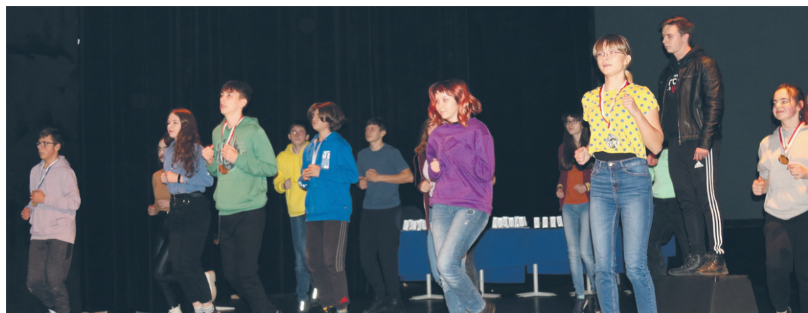
Podczas uroczystości harcerze zaprezentowali spektakl „Sekret”.