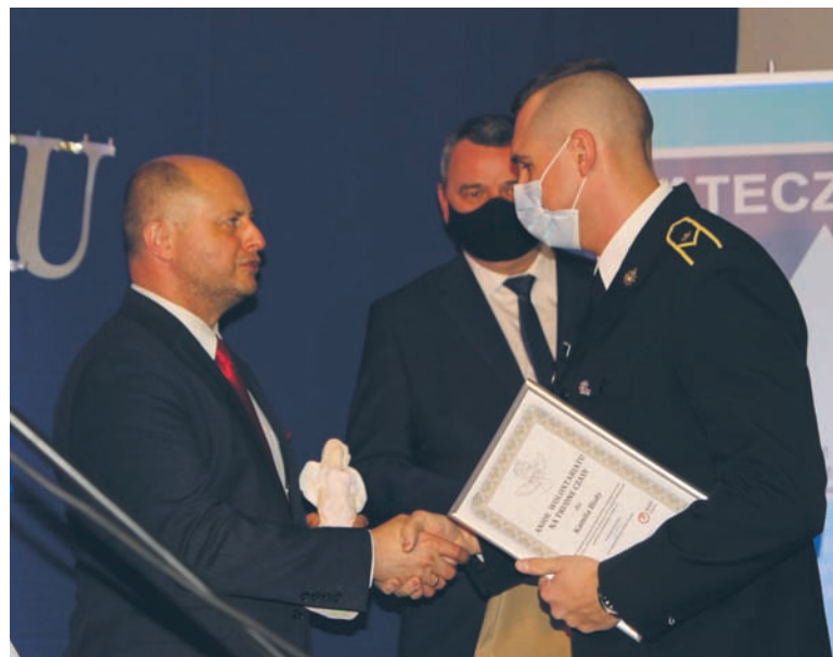
Gala „Anioły Wolontariatu” to okazja do wyróżnienia najbardziej aktywnych wolontariuszy.

39 osób, instytucji i firm zostało nagrodzonych statuetką „Anioła Wolontariatu” lub „Anioła Wolontariatu na trudne czasy” podczas piątkowej gali (19.11) w Osiedlowym Domu Kultury „Matecznik”. Ponadto przyznano 26 wyróżnień. Wydarzenie po raz 10. zostało zorganizowane przez Stowarzyszenie na Rzecz Dzieci i Młodzieży „Przystanek”.