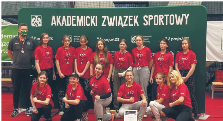
Młode szczypiornistki popisały się dobrą formą.

Szczypiornistki SPR-u Grunwald Ruda Śląska zagrały podczas Turniej Młodziczek w Piłce Ręcznej „Łączymy Nas Niepodległa” organizowanym przez Akademicki Związek Sportowy. W meczach grupowych rudzianki szybko uporały się z rywalkami, by w półfinale pokonać zespół As Fit Camp Warszawa.