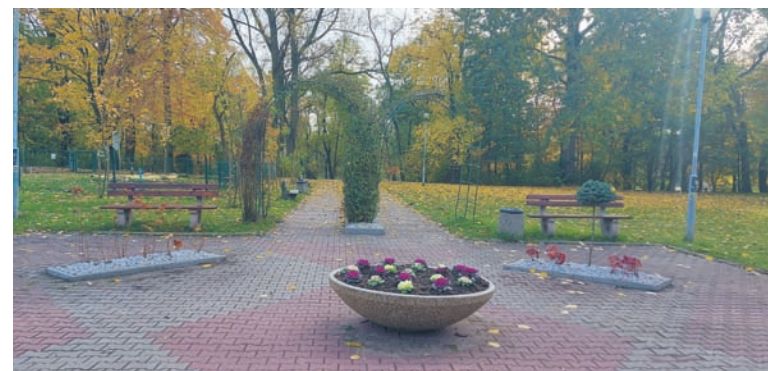
W bielszowickim parku posadzono m.in. kapusty ozdobne.

zwiększenie bioróżnorodności miejskiej zieleni. W sezonie letnim oraz w okresach suszy ograniczono koszenie trawników, a część terenów wyłączono z koszenia. Do zabezpieczenia nasadzeń stosowana jest kora, a do podlewania roślin miejskich wykorzystywana jest woda ze zbiorników na deszczówkę. Ponadto w ramach możliwości finansowych wykonywane są nasadzenia roślin wieloletnich. Na przykład w ostatnich tygodniach w centralnej części Parku Strzelnica w dzielnicy Bielszowice nasadzono takie rośliny jak: modrzew europejski Pendula szczepiony na pniu, świerk kłujący Globosa szczepiony na pniu, hortensja krzewiasta Pink Anabelle, rozplenica japońska Herbstzauber, rozplenica japońska Moudry, hortensja ogrodowa Polestar, kostrzewa sina, tawuła japońska Golden Princesse, Berberys Thunberga Florence oraz Berberys Thunberga Orange Torch.