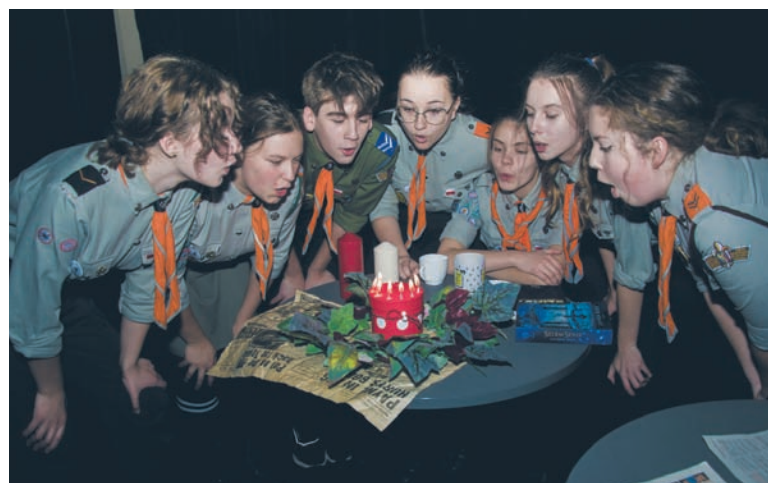
Do halembskiej drużyny „Młodych Wilków” należą dzieci w wieku 13-16 lat.