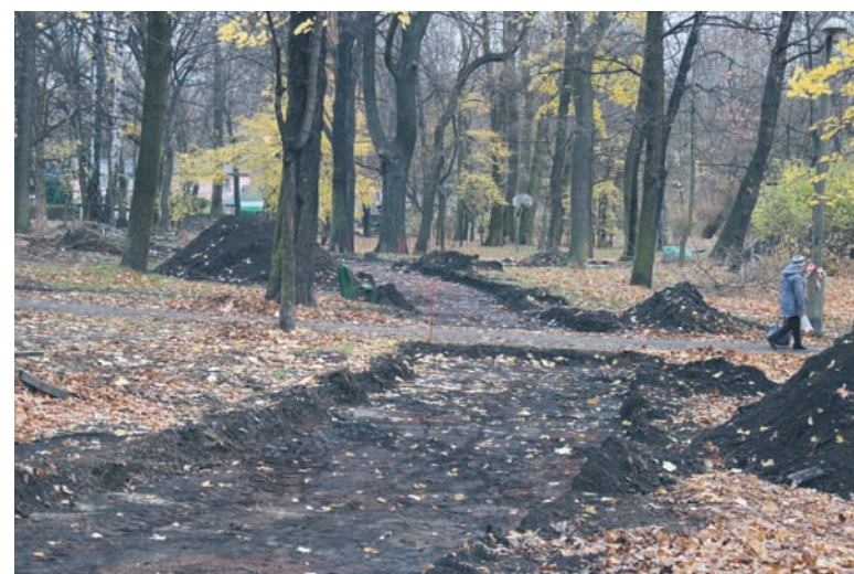
W parku przy ul. Parkowej w Nowym Bytomiu trwają intensywne prace ziemne.

Przypomnijmy, że dotychczas w ramach realizacji odcinków I-IV zrehabilitowano hałdę przy ul. 1 Maja (tzw. Góra Antonia) w Wirku. Następnie zrealizowana została odbudowa dawnego amfiteatru w pobliżu ul. Czarnoleśnej oraz stworzono w tym miejscu strefę wypoczynku. Z kolei w ubiegłym roku do użytku oddano odnowiony skwer przy ul. Tuwima. Ponadto na nowo zagospodarowano odcinek od ul. Nowary do ul. Katowickiej (tzw. trasa św. Wawrzyńca).