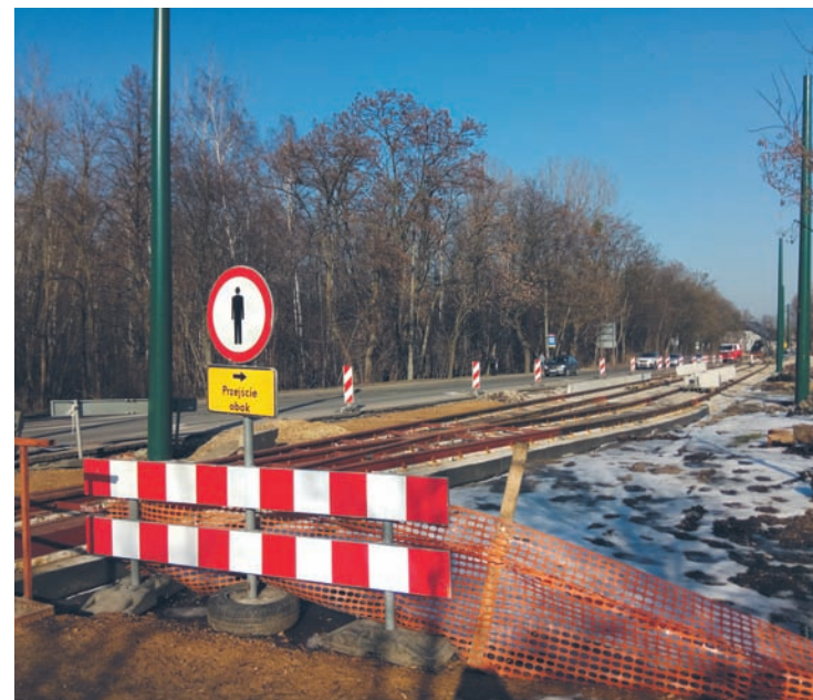
Obecnie trwa także modernizacja torowiska przy ul. Pawła w Chebziu.

Jednak i to nie oznacza, że linia nr 9 wróci na tory. To dlatego, że prowadzona jest modernizacja dalszych odcinków „dziewiątki” wzdłuż ul. Frycza Modrzewskiego w Bytomiu oraz od granicy z Rudą Śląską do ul. Zabrzeńskiej. Prace rozpoczęły się później niż w Rudzie Śląskiej i termin ich zakończenia to kwiecień 2022 roku. Tramwaje Śląskie liczą jednak na to, że wykonawca wcześniej zakończy zadanie, aby można było wznowić ruch tramwajowy między Rudą Śląską a Bytomiem. – Teoretycznie po zakończeniu prac na ul. Goduli będzie możliwość prowadzenia ruchu wagonami dwukierunkowymi do nowej mijanki przy ul. Młyn Szombierski, jednak na takie rozwiązanie musieliby przystać Zarząd Transportu Metropolitalnego i gmina Ruda Śląska.