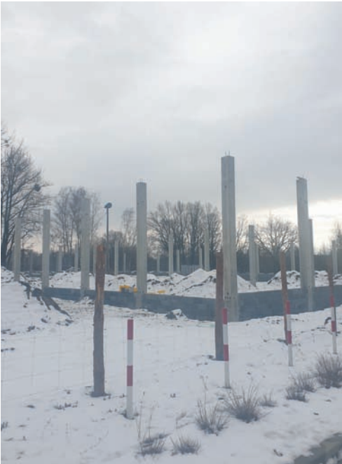
Na wysokości ul. Kłodnickiej 71 powstanie kolejny obiekt handlowo-usługowy.

Pierwotnym inwestorem, który miał realizować budowę przy ul. Kłodnickiej w Halembie, była spółka DEBT INFO z Poznania. To ona wniosła o pozwolenie na budowę dla inwestycji pn.: „budowa obiektu usługowo-handlowego wraz z instalacjami wewnętrznymi (instalacja wody, instalacja hydrantowa, instalacja kanalizacji sanitarnej, instalacja wentylacji, instalacja elektryczna, instalacja c.o.), instalacjami zewnętrznymi (instalacja wody, instalacja elektryczna, instalacja kanalizacji sanitarnej, instalacja kanalizacji deszczowej), miejscami postojowymi, pylonem reklamowym oraz murami oporowymi”. Decyzja ta przeniesiona została jednak na rzecz firmy AG REAL PROPERTY Sp. z o.o. z Wodzisławia Śląskiego i to właśnie ona obecnie (po kilka zmianach w zakresie zagospodarowania terenu i w parametrach obiektu budowlanego) realizuje inwestycję przy ul. Kłodnickiej. JO