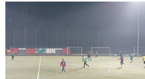
Zawodnicy spotkali się na sztucznym boisku w Sosnowcu.

Natomiast drugą część spotkania sosnowiczanie rozpoczęli od strzału zza szesnastki nad bramką,