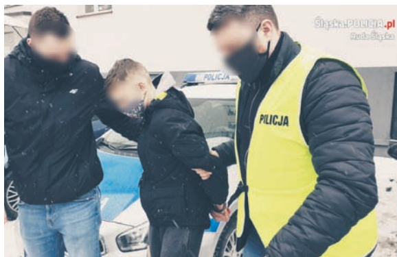
19-latek, który wyludził pieniądze od seniorów, w końcu sam padł ofiarą pułapki.

Niestety równocześnie przestępcy dalej działają metodami „na wnuczka”, czy „na policjanta”. W ubiegłym tygodniu rudzcy mundurowi zatrzymali 19-letniego mężczyznę, który tylko w jednym tygodniu trzy razy oszukał seniorów, wyludając od nich ponad 50 tys. zł. Na szczęście w końcu sam padł ofiarą pułapki zastawionej