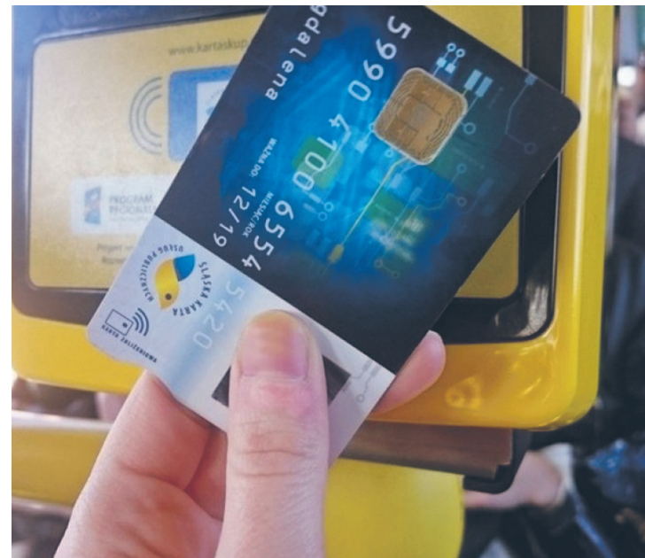
Zmiany w cenach biletów mają obowiązywać najwcześniej od drugiej połowy kwietnia.

Ponadto wprowadzone zostaną nowe bilety długookresowe na dwa miasta