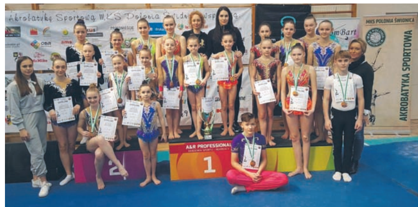
Akrobaci po raz kolejny udowodnili, że są w dobrej formie.