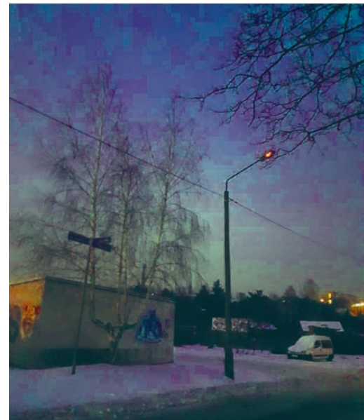
Zdjęcie wadliwie działającej latarni otrzymaliśmy od jednego z mieszkańców ulicy Szygarskiej.

Ponadto wciąż otrzymujemy od mieszkańców zapytania w sprawie tego, że od 1 maja ubiegłego roku ograniczone jest oświetlenie na ulicach Rudy Śląskiej. Władze miasta mówiły wówczas o oszczędnościach z tego ty-