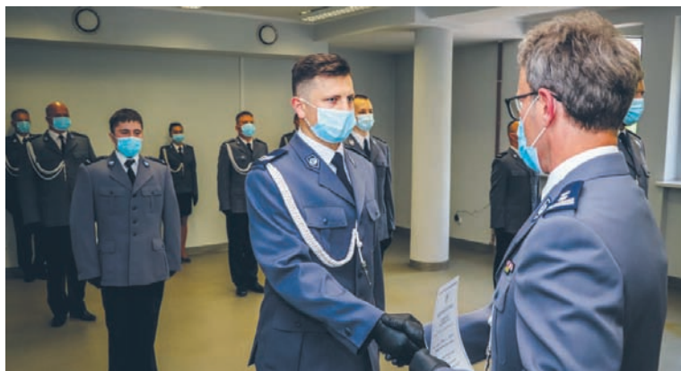
101 policjantów odebrało nominacje na wyższe stopnie służbowe.

Warto przypomnieć, że np. w ubiegłym roku rudzcy policjanci średnio dokonywali dziennie zatrzymania dwóch osób poszukiwanych i na gorącym uczynku sprawców przestępstwa oraz przyjmowali 65 zgłoszeń i przeprowadzali 43 interwencje. Poza tym spędzili 355 godzin w służbie patrolowej, 250 razy badali stan trzeźwości, legitymowali 117 osób, a także ujawnili 78 wykroczeń. Zorganizowali też trzy spotkania profilaktyczne, w których średnio brało udział 65 mieszkańców oraz realizowali dziewięć doprowadzeń.