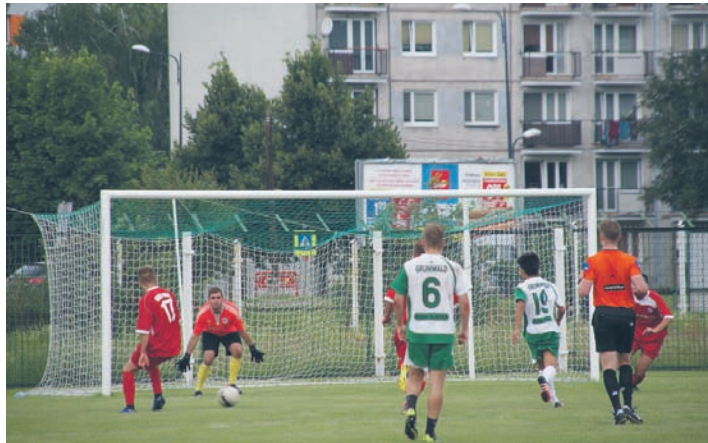
Zawodnicy Grunwaldu i Wawelu spotkali się podczas sparingu.

GRUNWALD RUDA ŚLĄSKA 6:2 WAWEL WIREK (2:1)