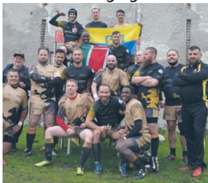
Zawodnicy KS Rugby Ruda Śląska zagraли na międzynarodowym turnieju.

Rudzkie Gryfy dobrze zaprezentowały się podczas Międzynarodowego Festiwalu Rugby, który odbył się w Piotrowicach Nyskich. Do rywalizacji stanęły dwie drużyny w turnieju rugby siedmioosobowego – KS Rugby Ruda Śląska „Czarna” i KS Rugby Ruda Śląska „Złota”.