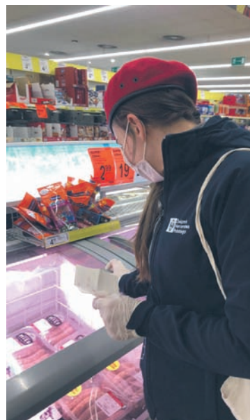
Harcerze z Rudy Śląskiej od kilku tygodni robią m.in. zakupy spożywcze dla potrzebujących seniorów.

Już od pojawienia się pierwszych obostrzeń związanych z koronawirusem zadeklarowali, że będą pomagać. Zakasali rękawy i postanowili wesprzeć starszych mieszkańców naszego miasta. Są cichymi bohaterami ostatnich tygodni. Mowa o harcerzach rudzkiego hufca ZHP. Każdego dnia kilkanaście osób wyrusza w miasto, by zrobić zakupy, zrealizować recepty, czy odebrać pocztę w imieniu seniorów z Rudy Śląskiej. W sumie w akcji uczestniczy ok. 50 społeczników.