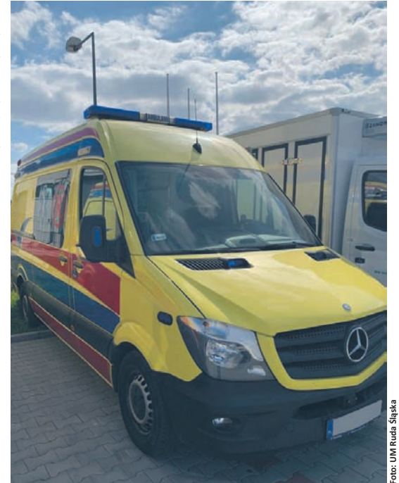
Drugi wymazobus jest już prawie gotowy.