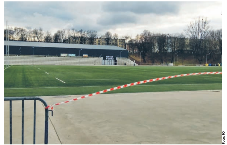
W poniedziałek (4.05) m.in. otwarta zostanie Burloch Arena.