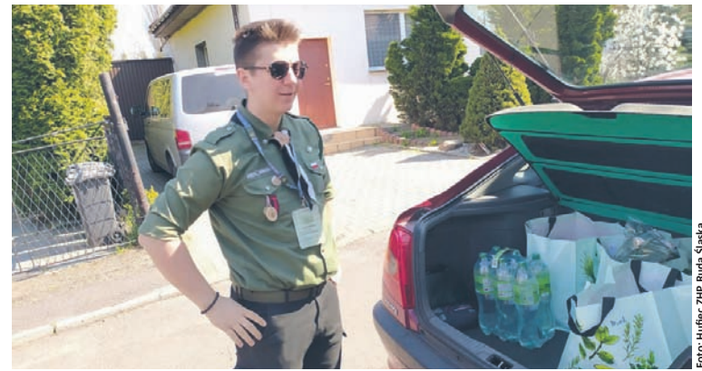
Zakupione produkty dostarczane są bezpośrednio do seniorów.