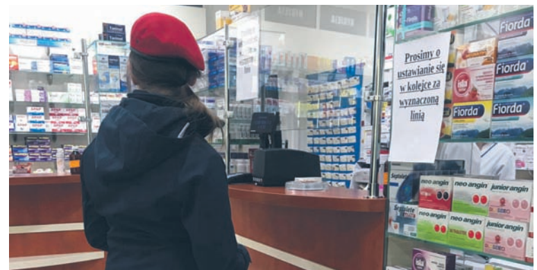
Starsze osoby mogą poprosić harcerzy także o zrealizowanie zakupów w aptece.