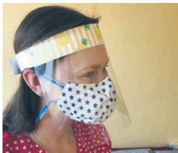
Jednym z najważniejszych „darów” są przyłbice.

Trwająca od kilku tygodni epidemia koronawirusa pokazała, że w trudnej sytuacji sporo osób potrafi zmobilizować siły, by pomagać innym. Dzięki temu pracownicy medyczni, którzy są na pierwszej linii kontaktu z osobami chorymi, a zarazem to w ich rękach pozostaje nasze zdrowie, mogą wykonywać swoje zadania w bezpieczniejszych warunkach.