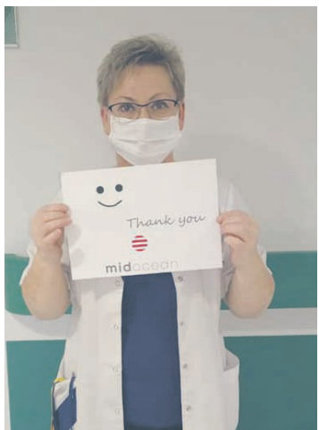
Pracownicy służby zdrowia podkreślają, że każde wsparcie jest potrzebne.

W ramach trwającej od ok. miesiąca akcji wolontariusze działający w grupie facebookowej „Radzi Rudzi” uszyli już kilka tysięcy maseczek dla m.in. pracowników śląskich szpitali, przychodni, a także dla seniorów, czy obsługi sklepów. Również na tym forum można znaleźć filmik instruktażowy, jak należy uszyć sobie maseczkę w domowych warunkach.