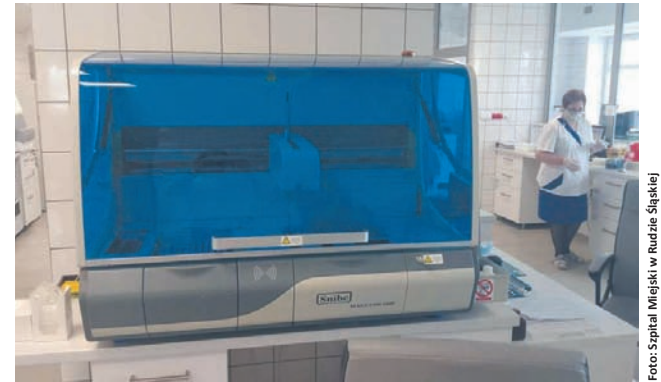
W rudzkim szpitalu prowadzone są przesiewowe badania pracowników medycznych.

39 mieszkańców Rudy Śląskiej jest zakażonych koronawirusem (stan na 20.04, godz. 14). Niestety dwie z nich zmarły. Niedawno okazało się, że głównym źródłem zakażeń w naszym mieście jest stacja dializ w Goduli. Dlatego też placówka została zdezynfekowana, podobnie jak teren dookoła oraz główne wejścia do pobliskiego Szpitala Miejskiego. Również w tym miejscu zostały wprowadzone dodatkowe rozwiązania. Od ubiegłego tygodnia trwają przesiewowe badania personelu. Kolejną cegiełką do walki z rozprzestrzenianiem się koronawirusa dołożyła Grupa Szpakmed, wprowadzając Mobilną Poradnię Medycyny Rodzinnej.