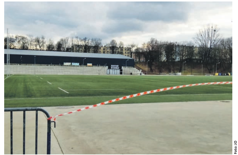
W weekend zamknięte zostały miejskie obiekty sportowo-rekreacyjne.

Wprowadzony od środy (25.03) zakaz opuszczania domów potrwa do 11 kwietnia. Zakaz nie obejmuje m.in. niezbędnej drogi do i z pracy, zrobienia zakupów, wizyt u lekarza, czy pomocy najbliższemu lub wolontariatu w ramach działań na rzecz walki z koronawirusem. Chodzi o niezbędne sprawy życia codziennego. Od 25 marca należy spotykać się maksymalnie w grupie dwóch osób (nie dotyczy to rodziny). Ponadto można poruszać się komunikacją miejską, ale z zachowaniem odpowiednich odstępów. W autobusie, tramwaju lub metrze tylko połowa miejsc siedzących może być zajęta. Kolejne przepisy zakazują również organizacji imprez, czy zebrań, ale nie dotyczy to spotkań z najbliższymi. Natomiast w obrzędach religijnych nie może uczestniczyć więcej niż pięć osób (chodzi o uczestników, a nie sprawujących posługę). Nad przestrzeganiem przepisu ma czuwać policja oraz straż miejska. W Rudzie Śląskiej władze miasta w sobotę podjęły decyzję o zamknięciu stadionu lekkoatletycznego w Nowym Bytomiu, boisk typu Orlik oraz Burloch Areny. Nadal zamknięte są m.in. miejskie place zabaw, instytucje kultury, baseny miejskie, hale sportowe oraz Aquadrom. Odwołano również wszystkie