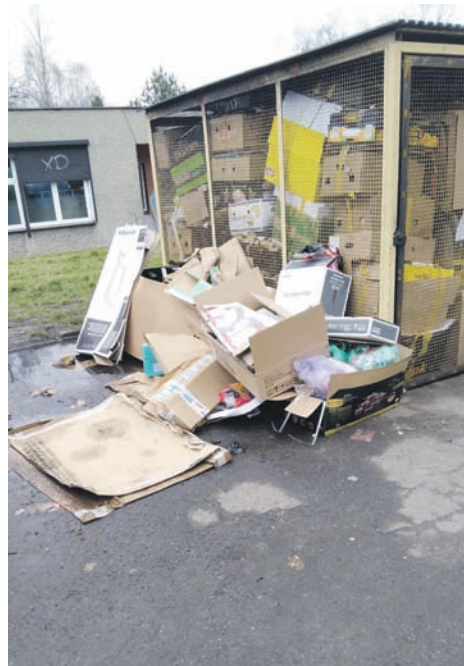
Zdjęcie śmietników przy ul. Podlas nadesłał jeden z mieszkańców.

Spółdzielnia przeprowadziła również rozmowę z zarządcami pobliskich budynków. – Gromadzenie kartonów oraz worków z odpadami przy placu gospodarczym jest wynikiem podrzucania przez mieszkańców okolicznych budynków, między innymi nienależących do RSM, dlatego też przeprowadzona została rozmowa z zarządcą budynków z prośbą o dyscyplino-