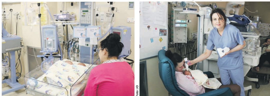
Personel neonatologii dba o to, by kontakt dziecka z rodzicem był jak najczęstszy.