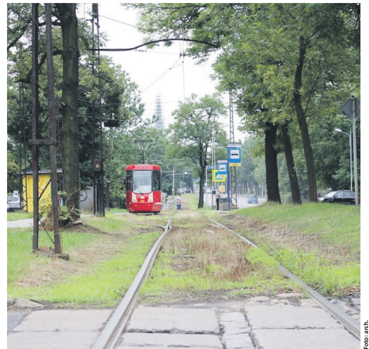
Prace będą prowadzone na odcinku od mostu kolejowego w Chebziu do granicy z Bytomiem.

Na czas prowadzenia prac konieczne będzie wprowadzenie zmian w organizacji ruchu zarówno tramwajowego, jak i samochodowego. Ze względu na to, że modernizowany będzie odcinek jednotorowy, linia nr 9 nie będzie kursować przez Godulę. W jej miejsce uruchomiona zostanie komunikacja zastępcza. Zmiany dotkną także kierowców, ponieważ wykonawca w trakcie remontu będzie musiał zająć część drogi. Na to jednak dopiero przyjdzie czas. – W pierwszej