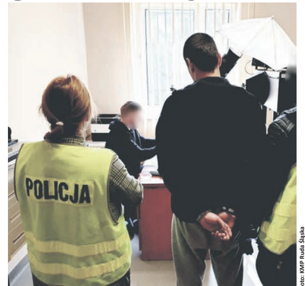
22-latek trafił do policyjnego aresztu.

Mężczyzna został zatrzymany w swoim mieszkaniu. Ilość znalezionych narkotyków pozwoliłaby przestępcy na przygotowanie ponad 2500 dilerkich działek. Zabezpieczone środki odurzające zostały przekazane do dalszych badań, a 22-letni rudzianin trafił do policyjnego aresztu. Śledczy już go przesłuchali, a prokurator przedstawił mężczyźnie zarzuty posiadania znacznej ilości narkotyków i zastosował wobec niego policyjny dozór. JO