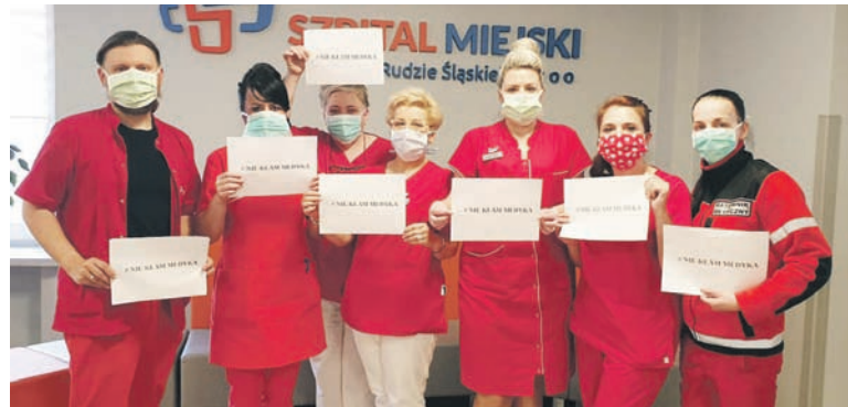
Personel rudzkiego Szpitala Miejskiego apeluje do mieszkańców o szczerość.

Po tym jak w piątek (20.03) w całym kraju zarządzony został stan epidemii, od 25 marca rząd wprowadził radykalny zakaz opuszczania domów. Równocześnie zapadła decyzja, że zajęcia w placówkach edukacyjnych nie zostaną wznowione aż do Wielkanocy. Natomiast w Rudzie Śląskiej zamknięto place zabaw i obiekty sportowe. Centrum Zarządzania Kryzysowego nadaje na ulicach miasta komunikaty zachęcające do pozostania w domach. W Rudzie Śląskiej wprowadzony zostanie również pakiet osłon dla przedsiębiorców, którzy coraz bardziej odczuwają skutki epidemii koronawirusa. Tymczasem nadal rośnie liczba zakażonych osób. We wtorek (24.03) Ministerstwo Zdrowia podało, że zarażonych jest 884 mieszkańców Polski (stan na godz. 19), w tym dziesięć osób zmarło. W Rudzie Śląskiej odnotowano na razie jeden przypadek zachorowania na koronawirusa.