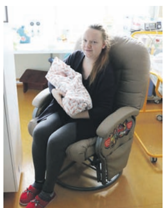
Dziecko może poczuć bliskość rodzica podczas kangurowania na fotelu z WOŚP.

Lepszy rozwój noworodków w kolejnych tygodniach ich życia jest możli-