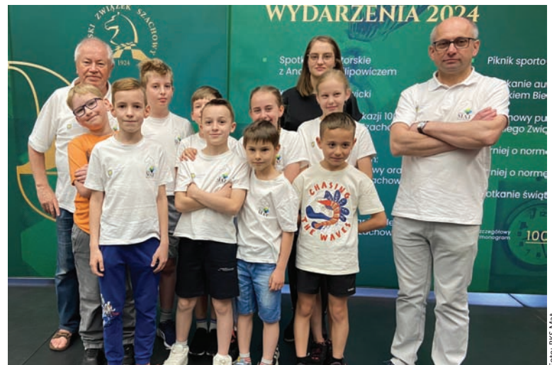
Udane występy rudzian uświetniły setną rocznicę powstania Śląskiego Związku Szachowego.