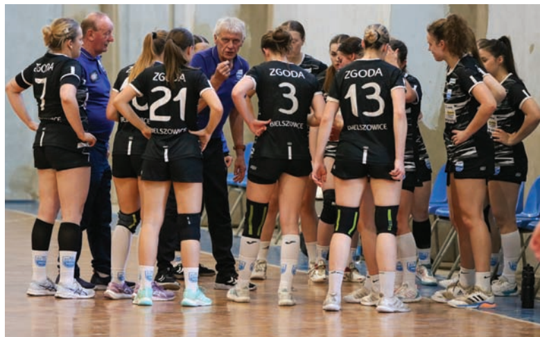
Bielszowiczanki kolejne spotkanie na własnej hali zagrają 9 maja (czwartek) o godz. 19.

Szczypiornistki Zgody Ruda Śląska przegrały 35:40 (16:18) z SPR-em Olkusz w ramach 17. kolejki I ligi kobiet. Po dwunastu rozegranych spotkaniach bielszowiczanki zajmują czwarte miejsce w tabeli.