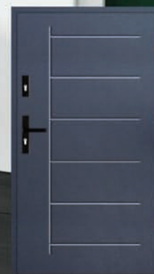
Drzwi wejściowe z wymianą – 2490 zł

Wycena dla rozmiaru 80 lub 90, do programu Czyste Powietrze