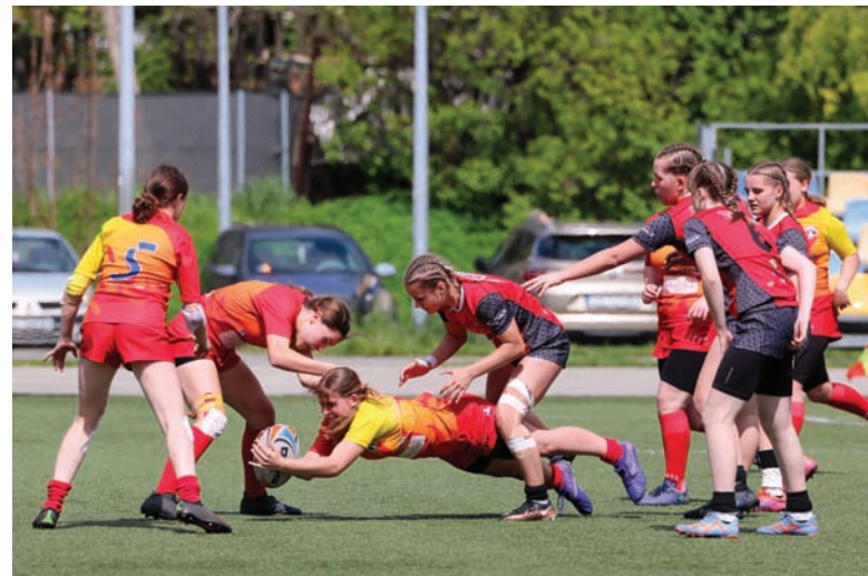
Ambitna postawa do samego końca pozwoliła Diablicom zająć czwarte miejsce.

W grupie eliminacyjnej „Diabełki” uległy w pierwszym meczu Amazonkom z Lublina 0:48, aby w drugim wygrać z Girls RT Olsztyn 31:12. Drugie miejsce w grupie wystarczyło, aby zagrać w półfinale. Tu jednak lepsze okazały się Atomówki Łódź, które wygrały z rudziankami 27:0. Nie oznaczało to jednak koniec zmagania dla młodych rudzianek, które zagrały jeszcze istotny mecz o trzecie miejsce z Tytankami Gniezno. Oba zespoły sąsiadują ze sobą w klasyfikacji generalnej, ale tym razem lepsze okazały się zawodniczki z województwa wielkopolskiego, zwyciężając 38:5. Dało to Diablicom czwarte miejsce. Turniej natomiast wygrały Amazonki z Lublina, które pokonały