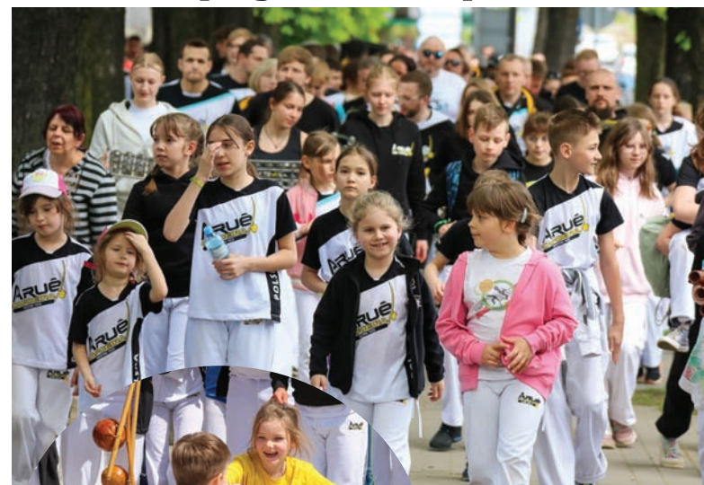
W sobotę (27.04) uczestnicy festiwalu przeszli muzycznym krokiem z hali przy ulicy Hallera na plac Jana Pawła II.

Capoeira to sport dla osób w każdym wieku, czego dowód mogliśmy zobaczyć podczas treningów otwartych.