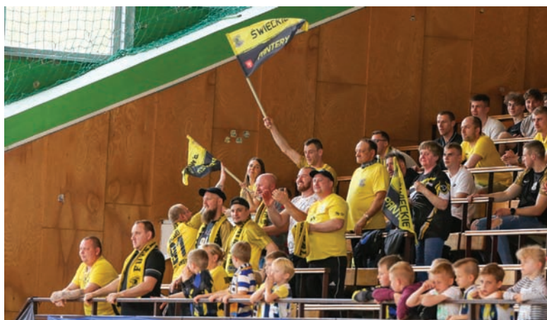
Niesieni dopingiem swoich kibiców zawodnicy ze Świecia wywieźli z Halemby bardzo cenne zwycięstwo.