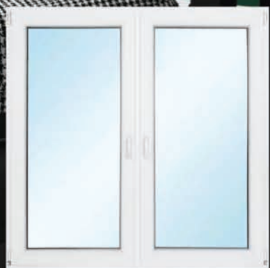
Energooszczędne okno z wymianą – 1530 zł*

Wycena dla rozmiaru 140x140 cm, 3 szyby, do programu Czyste Powietrze