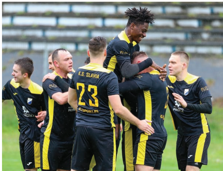
Dzięki trzem punktom Slavia utrzymała się na drugim miejscu w tabeli A klasy.

Trzy rzuty karne, siedem bramek i emocje do ostatnich sekund – tak wyglądały sobotnie (20.04) derby Rudy Śląskiej, w których Slavia pokonała Wawel Wirek 4:3 (3:1).