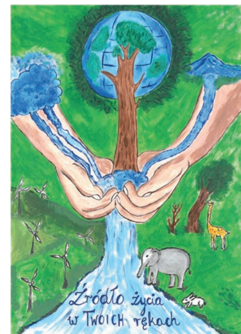
II miejsce – Sandra Sobańska – SP nr 41