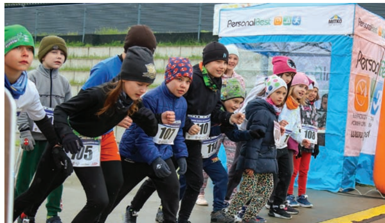
W zmaganiach w deszczowej aurze wzięło udział 141 osób, w tym 16 dzieci.