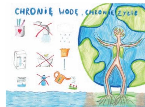
III miejsce – Zofia Jezuit – SP nr 40