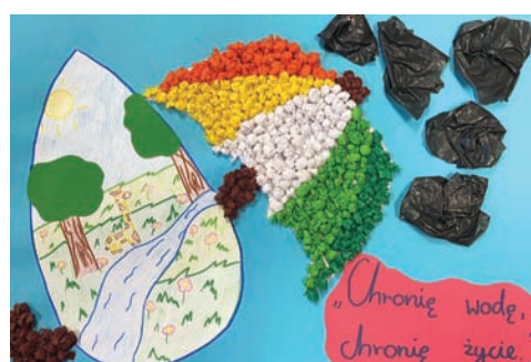
Milena Grzywaczewska – SP nr 24 – wyróżnienie