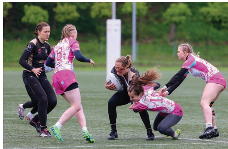
Dzielną postawą z Budowlanymi Łódź zapewniła rudziankom utrzymanie w Ekstralidze.

Diablice rozpoczęły zmagania grupowe od porażki 0:47 z najlepszą drużyną w Polsce – Białozielonymi Ladies Gdańsk. W kontekście utrzymania bytu w Ekstralidze najważniejszy był jednak mecz z Budowlanymi WiszjaMed Łódź, który rudzianki po emocjonującym starciu wygrały 17:12. Oznaczało to, iż Diablice na pewno zagrają w Gdańsku w Ekstralidze i dodatkowo miały szansę na zajęcie miejsca na podium na własnym boisku. W półfinale zmierzyły się z Legią Warszawa i przegrały 0:35, natomiast w meczu o trzecie miejsce niestety okazały się słabsze od Mazovii Mińsk Mazowiecki i poniosły porażkę 12:24, co dało finalnie czwartą lokatę.