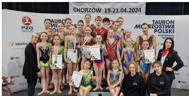
W Chorzowie zespoły KPKS-u stawały na podium sześciokrotnie.

Zawodniczki i zawodnicy KPKS-u „Halemba” pokazali się ze świetnej strony podczas 70. Mistrzostw Polski Seniorów w Akrobacie Sportowej, które w dniach 20-21 kwietnia odbyły się w Chorzowie.