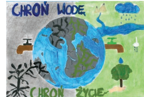
Alan Thoma – SP nr 35 – wyróżnienie