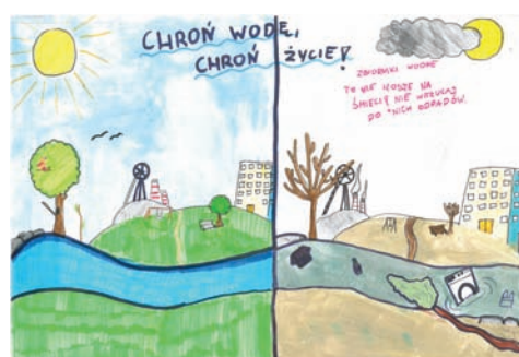
Iga Matejczyk – SP nr 24 – wyróżnienie