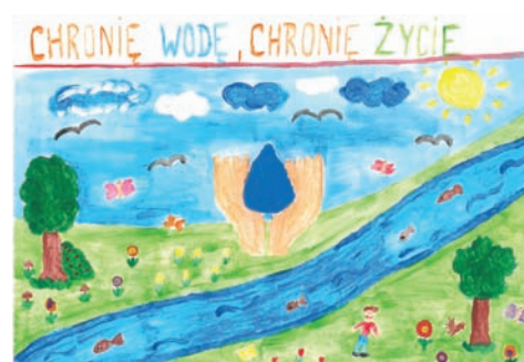
Kajetan Książkiewicz – SP nr 1 – wyróżnienie