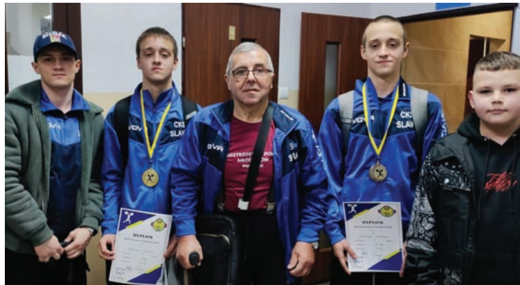
W Piekarach Śląskich zawodnicy CKS-u zdobyli trzy medale.

Rudzcy ciężarowcy wywalczyli trzy medale podczas mistrzostw Śląska juniorów do lat 15 i 17. Turniej odbył się 20 kwietnia na pomostach w Piekarach Śląskich.