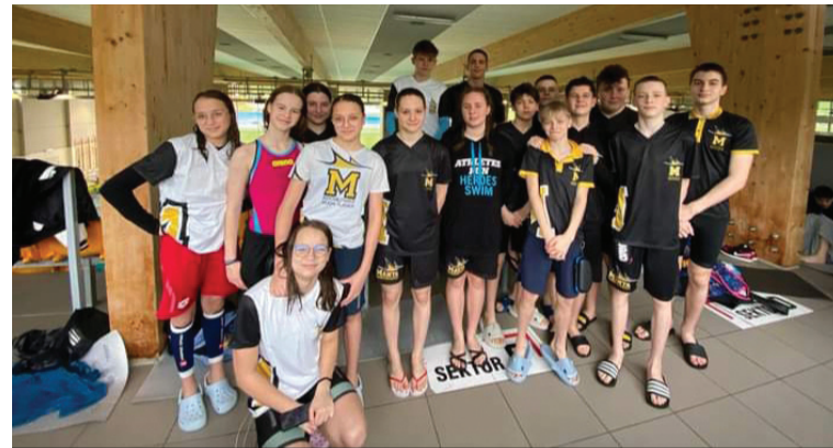
Regularne starty i świetne wyniki dały Manticę wysokie miejsca w klasyfikacji klubowej.

Pozwoliły one na zamknięcie klasyfikacji punktowej dla wszystkich klubów, które wzięły udział w lidze. I tak w roczniku 2012 UKS Manta Kochłowice zajęła czwarte miejsce, a UKP Ruda Śląska czternaste. W roczniku 2011 Manta została sklasyfikowana na drugim, a UKP na szesnastym miejscu. W zmaganiach młodzieży z rocznika 2010 Manta uplasowała się na trzecim miejscu, a UKP na dziewiątym, natomiast w roczniku 2009 drużyna Manty była czwarta, a zespół UKP dziesiąty. Wyniki te są podsumowaniem czterech edycji ligi dla każdego ze wspomnianych roczników – za-