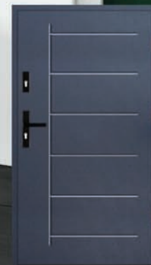
Drzwi wejściowe z wymianą – 2490 zł

Wycena dla rozmiaru 80-lub 90, do programu Czyste Powietrze