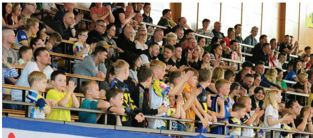
Mimo dużego wsparcia z trybun rudzianie przegrali hitowe starcie.