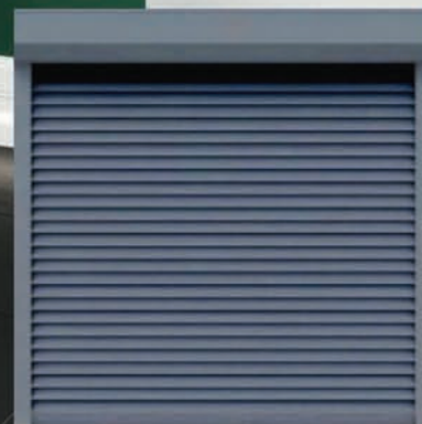
Roleta zewnętrzna z montażem – 690 zł*

Wycena dla rozmiaru 140x140 cm, 3 szyby, do programu Czyste Powietrze