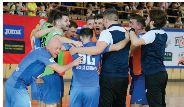
Na dwie kolejki przed końcem to AZS UŚ Katowice jest faworytem do bezpośredniego awansu.