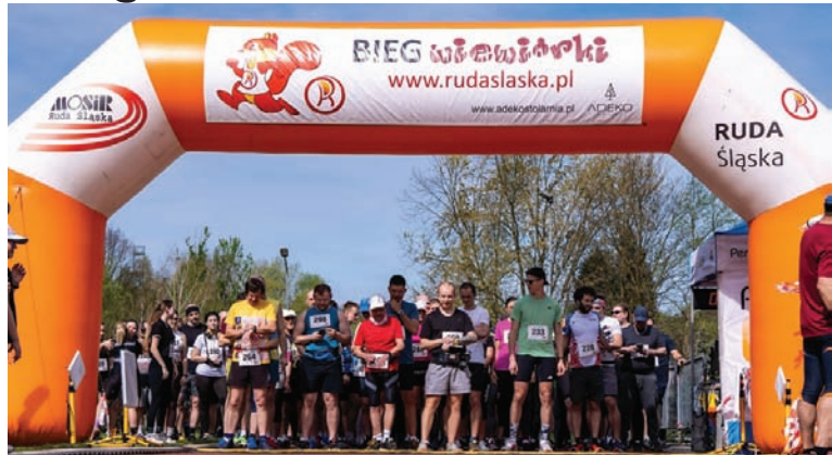
Ponad 300 osób wystartowało w drugiej edycji tegorocznego „Biegu Wiewiórki”.

W sobotnie przedpołudnie (7.04) tradycyjnie na terenie lasów halembskich oraz Szkoły Podstawowej nr 15 Sportowej odbył się drugi w tym roku „Bieg Wiewiórki”. Na starcie zameldowały się 302 osoby.