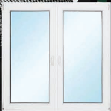
Energooszczędne okno z wymianą – 1530 zł*

Wycena dla rozmiaru 140x140 cm, 3 szyby, do programu Czyste Powietrze