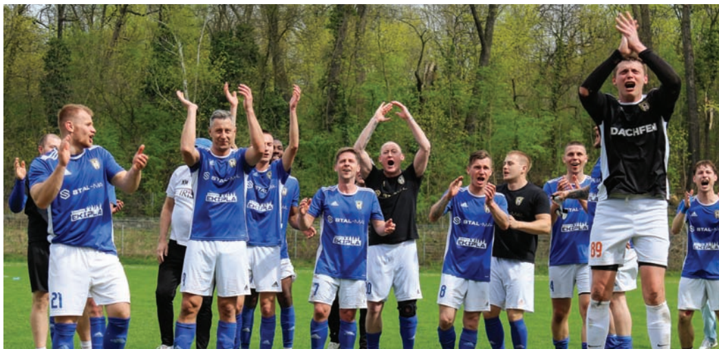
Po zwycięstwie w Rudzie Jastrzęb wskoczył na fotel lidera A klasy.

Jastrzęb Bielszowice pokonał na wyjeździe Slavię Ruda Śląska 1:3 (1:1) w 15. kolejce katowickiej A klasy. Dzięki zwycięstwu drużyna Artura Opeldusa awansowała na pierwsze miejsce w tabeli.