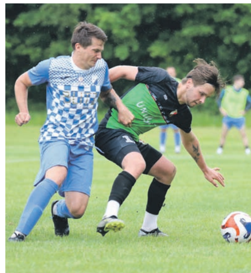
Slavia w kolejnym meczu zmierzy się na wyjeździe z LKS Pogonią Imielin, natomiast Urania 14 czerwca podejmie u siebie CKS Czeladź. Mecz ten rozegrany zostanie o godzinie 12:00.

Druga połowa rozpoczęła się podobnie jak pierwsza – Slavia ruszyła do ataku z dużą determinacją. Już w 47. minucie gospodarze groźnie zaatakowali po rzucie różnym, ale znów zabrakło precyzji. Chwilę później, w 48. minucie, doszło do kontrowersyjnej sytuacji w polu karnym – Nowak upadł po kontakcie z obrońcą Slavii, ale sędzia pozostał niewzruszony i nie podyktował jedenastki. W tym momencie nad stadionem przeszła ogromna ulewa, która nie pomagała zawodnikom w rozgrywaniu meczu. Z minuty na minutę presja gospodarzy rosła. W 54. minucie znów próbowali zagrać piłkę ponad linią obrony, ale akcja zakończyła się jedynie rzutem różnym. Slavia miała inicjatywę, lecz brakowało jej skuteczności i zimnej krwi pod bramką przeciwnika. Urania natomiast czekała na swoją okazję, by zadać decydujący cios. W 69. minucie Nowak spróbował szczęścia