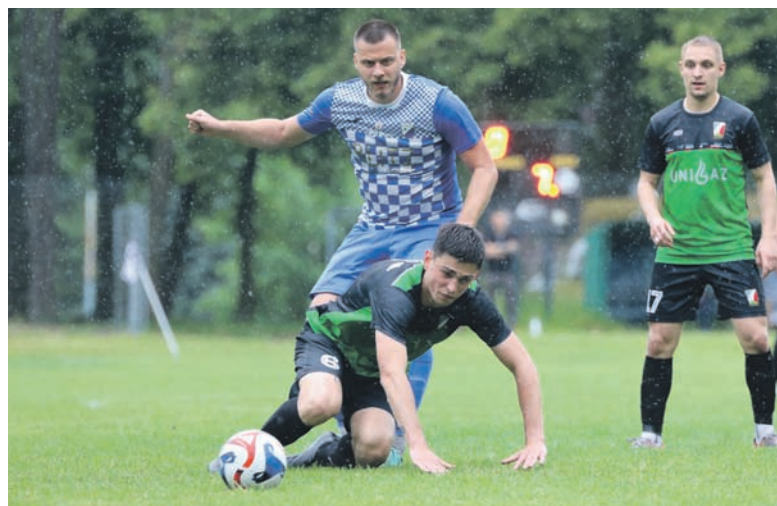
W drugiej połowie meczu nad stadionem przeszła wielka ulewa, lecz nie powstrzymała ona piłkarzy od rozegrania meczu do końca.

Dla Uranii było to trzecie zwycięstwo derbowe z rzędu – po pokonaniu Wawelu Wirek i Jastrzębia Bielszowice, teraz przyszła kolej na prestiżowy triumf nad Slavią. Dzięki tej wygranej zespół awansował na 11. miejsce w tabeli, wciąż znajdując się w gronie drużyn walczących o utrzymanie. Aż sześć zespołów dzieli zaledwie 2 punkty, co zwiastuje prawdziwy thriller w końcówce sezonu Klasy Okręgowej. Slavia, mimo porażki, zachowuje czwartą lokatę i wciąż ma szansę na wysokie zakończenie sezonu, jednak z pewnością mecz derbowy pozostawił niedosyt. Choć dominowali w wielu fragmentach spotkania, nie potrafili przełożyć przewagi na wynik, a skuteczność gości była tego dnia bezlitosna.